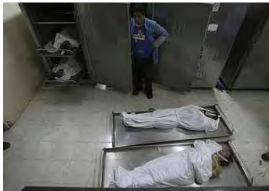
Les corps des Palestiniens morts asphyxiés dans le tunnel (Palestine-info, 29 avril 2010)