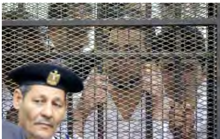
Les membres d'une cellule du Hezbollah condamnés en Egypte (Al-Ahram, 28 avril 2010)