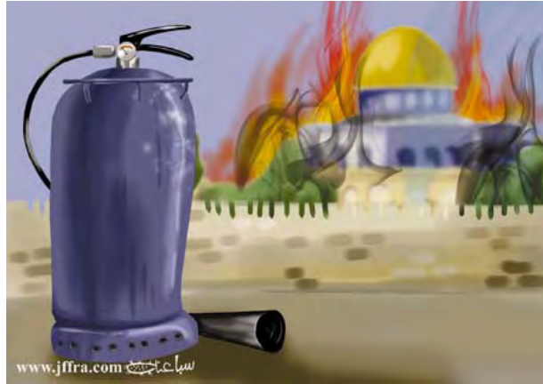
Critique de l'impuissance arabe : la mosquée Al-Aqsa en flammes et personne ne vient prendre l'extincteur (Al-Hayat Al-Jadeeda, 2 avril 2010)