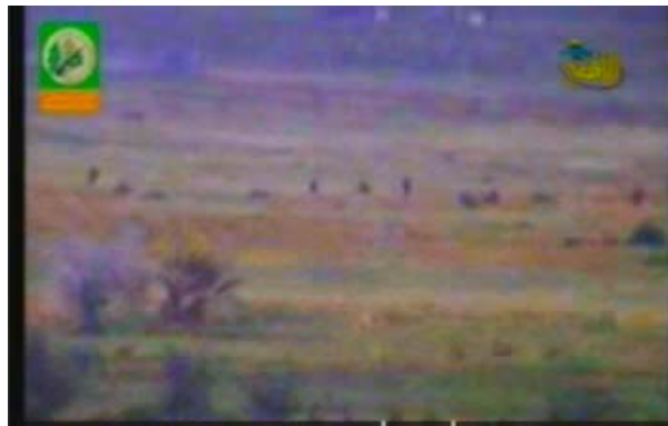
Echange de tirs entre Tsahal et les Brigades Izz al-Din al-Qassam (Site Internet des Brigades Izz al-Din al-Qassam, 28 mars 2010)