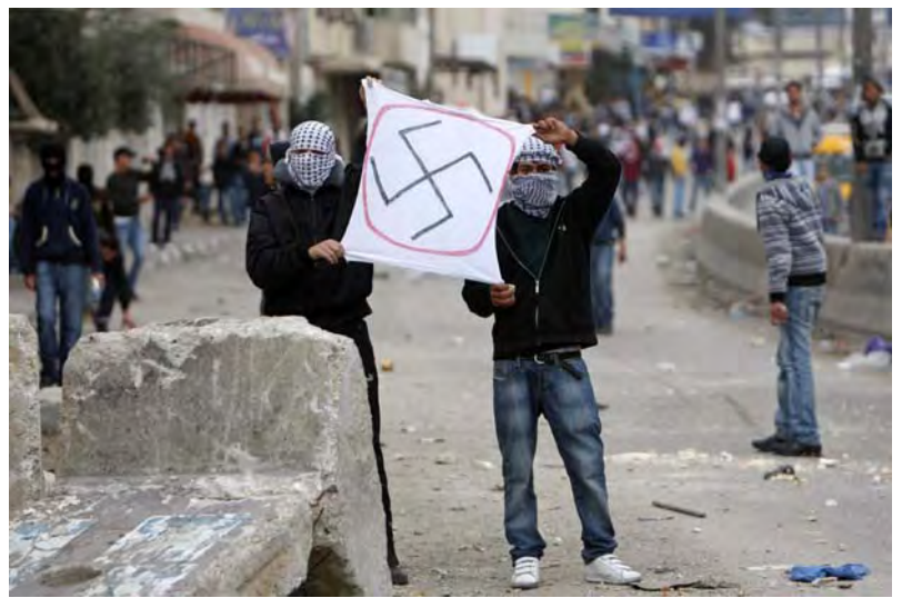
Incitation à la violence : "Il n'y a pas d'autre voix que la voix de l'intifada," paraphrase du slogan du Fatah, "Il n'y a pas d'autre voix que la voix de la bataille" (Forum Internet du Fatah, 15 mars 2010)