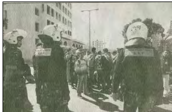
Les services anti-émeute de l'Autorité Palestinienne refusent aux Palestiniens de Bethléem l'accès aux sites conflictuels (Al-Quds, 19 mars 2010)