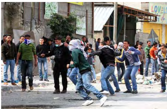
Emeutiers palestiniens près du barrage de Qalandia (Agence de presse Wafa, 19 mars 2010)

médias ont annoncé que d'après des témoins, des douzaines de jeunes ayant participé à une manifestation contre les actions d'Israël à Jérusalem et l'inauguration de la synagogue Hurva, ont reçu l'ordre de se rendre dans des centres d'interrogatoire dans diverses villes de Judée-Samarie. Des ordres semblables ont été envoyés aux prédicateurs des mosquées qui avaient incité le public à manifester en soutien aux lieux saints de l'Islam à Jérusalem (Site Internet du Centre Al-Bayan, 18 mars 2010).