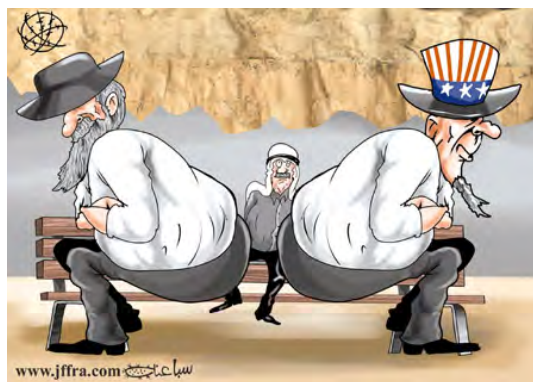
La crise des relations américano-israéliennes (Al-Hayat Al-Jadeeda, 23 mars 2010)