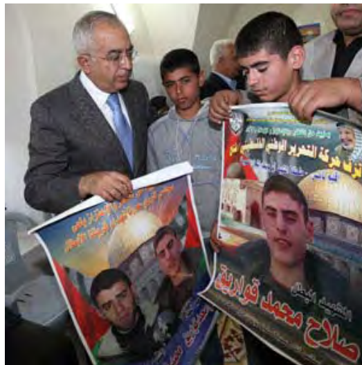
Salam Fayyad effectue une visite de condoléance au domicile des deux Palestiniens tués en tentant d'attaquer une patrouille de Tsahal (Al-Hayat Al-Jadeeda, 23 mars 2010)

● 20 mars - Deux Palestiniens ont utilisé des fourches à foin lors d'une tentative ayant pour but d'attaquer une patrouille de Tsahal au Sud-Est de Naplouse. En réponse, les soldats ont ouvert le feu et ont tué les terroristes (Porte-parole de Tsahal, 21 mars 2010).