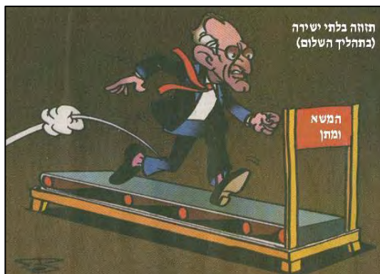
George Mitchell sur le tapis de jogging des négociations indirectes (Al-Ayam, 19 mars 2010)