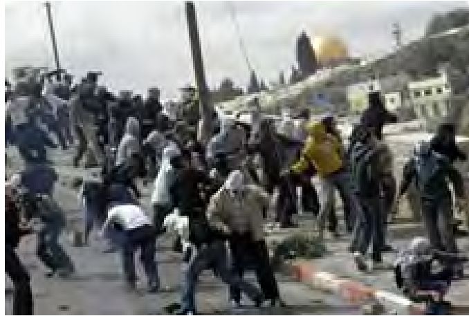
Palestiniens jetant des pierres à Jérusalem Est

■ Le Hamas a lancé une campagne visant à enflammer les cœurs et les esprits au sujet de Jérusalem, et à encourager les émeutes. Il a appelé à déclarer le 16 mars "journée de colère et de défense de la Mosquée Al-Aqsa et de Jérusalem." L'inauguration de la synagogue Hurva le 15 mars a été utilisée par le Hamas et le Fatah pour exhorter le public palestinien en affirmant à tort qu'Israël planifiait de détruire la Mosquée Al-Aqsa et d'y construire le Troisième Temple.