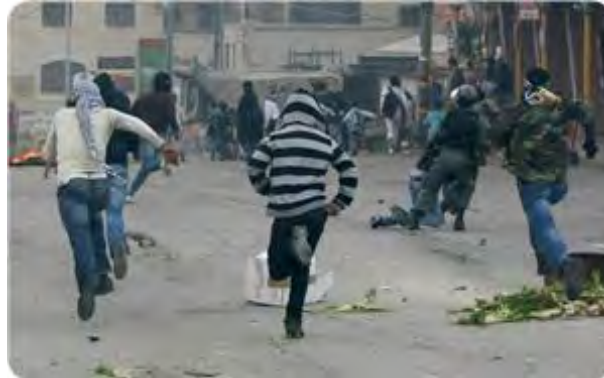
Emeutiers palestiniens à Jérusalem Est

appels ont été lancés à reprendre la lutte armée contre Israël. La "journée de la colère" a également été marquée par une manifestation dans la bande de Gaza contrôlée par le Hamas.