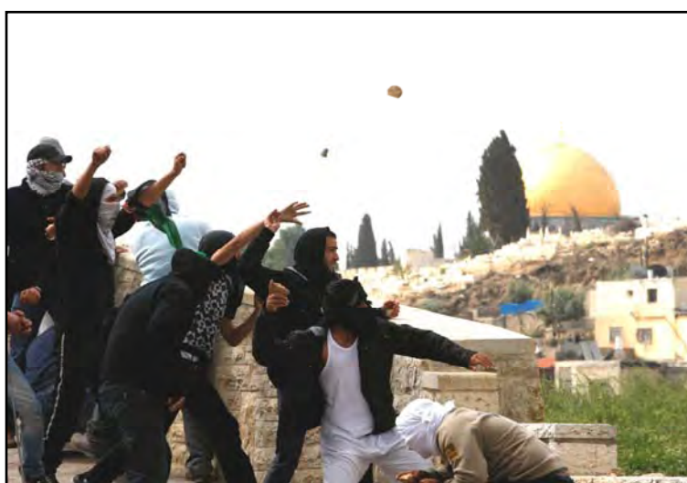
Palestiniens jetant des pierres sur les forces de sécurité israéliennes à Wadi Joz près de Jérusalem Est (Baz Ratner, Reuters, 16 mars 2010)