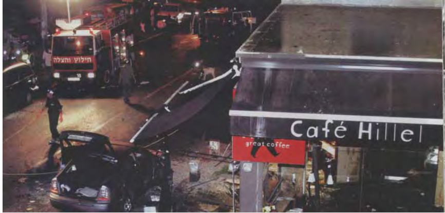
Le Café Hille à Jérusalem, cible d'un attentat suicide (Filastin al-Muslima, Octobre 2003)

témoignait du "rôle perfide joué par l'Autorité Palestinienne dans sa coordination sécuritaire avec Israël" (Télévision Al-Aqsa, 24 mars 2010).