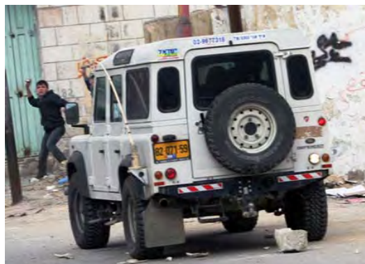
Manifestants à Hébron jetant des pierres sur un véhicule de Tsahal (Agence de presse Wafa, 22 février 2010)

■ Cette semaine, des manifestations et des émeutes ont été signalées suite à la décision d'inclure le Caveau des Patriarches et le Tombeau de Rachel sur la liste des sites du patrimoine national. La plupart des émeutes et des manifestations ont eu lieu à Hébron, mais d'autres événements ont été signalés ailleurs en Judée-Samarie et dans la bande de Gaza. Ci-dessous les principaux incidents de Hébron :