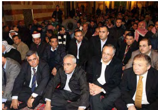
Salam Fayyad participe aux prières du vendredi à la mosquée du Caveau des Patriarches à Hébron (Agence de presse Wafa, 26 février 2010)