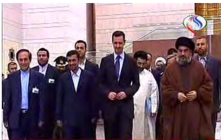
Le Président syrien Bashar Al-Assad, le Président iranien Mahmoud Ahmadinejad et le Secrétaire général du Hezbollah Hassan Nasrallah à Damas