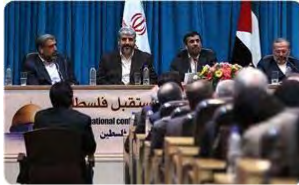
Le Président iranien Ahmadinejad durant une conférence de presse avec Khaled Mashaal, le chef du bureau politique du Hamas, à la Conférence de solidarité islamique nationale pour l'avenir de la Palestine (Site Internet du Hamas Palestine-Info, 28 février 2010)