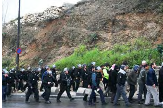
Manifestants opposés à la police israélienne à Jérusalem Est

émeutes se sont ensuite diffusées à d'autres quartiers de Jérusalem Est, dont ceux de Ras Al-Amoud et Sur Baher. Quatre policiers ont été blessés par des tirs de pierres. 18 manifestants ont été blessés et sept autres ont été arrêtés.