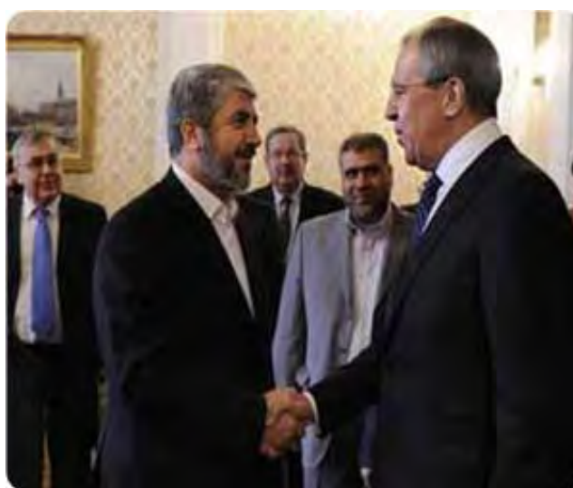
Khaled Mashaal, le chef du bureau politique du Hamas, et le ministre russe des Affaires étrangères Sergei Lavrov à Moscou le 12 février (Site Internet du Hamas Palestine-info, 13 février 2010)