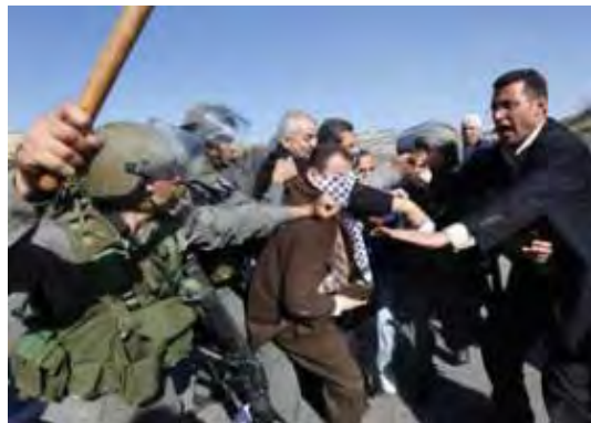
Tawfiq Tirawi, membre du comité central de l'OLP, opposé à des soldats de Tsahal à Dir Nazem (Al-Ayam, 15 janvier 2010)

à l'AP ont récemment publié de nombreux articles encourageant la poursuite des "activités de protestation populaire" [syndrome Bili'in]. 3