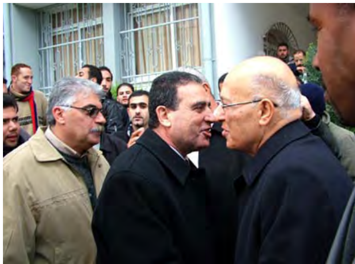
Nabil Shaath, haut responsable du Fatah, lors d'une visite exceptionnelle dans la bande de Gaza (Agence de presse Wafa, 3 février 2010)