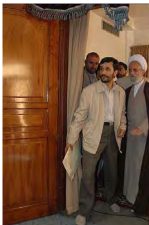
Ahmadinejad (à gauche) avec son mentor spirituel, Mesbah-Yazdi

15. L'utilisation de cette terminologie, qui excuse de fait la violence contre les adversaires de régime, trouve son expression sur le terrain. Jusqu'ici, cinq manifestants ont été arrêtés pendant les émeutes de l'Ashura et ont été accusé d'agir contre l'Islam, ce qui signifie qu'ils peuvent être condamnés à la peine de mort. Il s'agit peut-être d'une nouvelle phase dans les meurtres politiques de responsables de l'opposition iranienne, fondés sur l'autorisation juridico-religieuse de commettre de tels actes fournie par Mesbah-Yazdi, qui s'appuie sur la loi islamique pour légitimer ces meurtres au service de la direction iranienne.