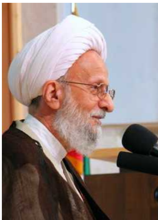
L'Ayatollah Mesbah-Yazdi

Dans un discours aux Gardiens de la Révolution, l'Ayatollah Mesbah-Yazdi, le mentor spirituel d'Ahmadinejad, a accusé les Juifs et les sionistes d'être corrompus et d'encourager la résistance contre le régime dans le cadre de leurs efforts pour "contrôler le monde et détruire l'Islam"