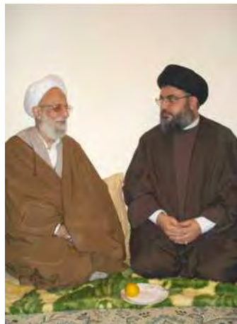
Mesbah-Yazdi et Hassan Nasrallah

5. Mesbah-Yazdi s'est rendu au Liban où il a rencontré le leader du Hezbollah Hassan Nasrallah. Il a enseigné dans plusieurs institutions religieuses, dont au Séminaire Haghani, et a joué un rôle actif dans la lutte pour renverser le Shah. Après la mort de Khomeiny, il était l'une des autorités religieuses ayant soutenu la nomination de Khamenei comme son successeur (bien que ce dernier n'ait pas atteint de haut rang clérical), le préférant au Grand Ayatollah Montazeri (décédé récemment). En échange, Mesbah-Yazdi a demandé - et reçu - un budget pour l'établissement d'un centre de recherche et d'éducation au nom de l'Imam Khomeiny, qu'il dirige toujours.