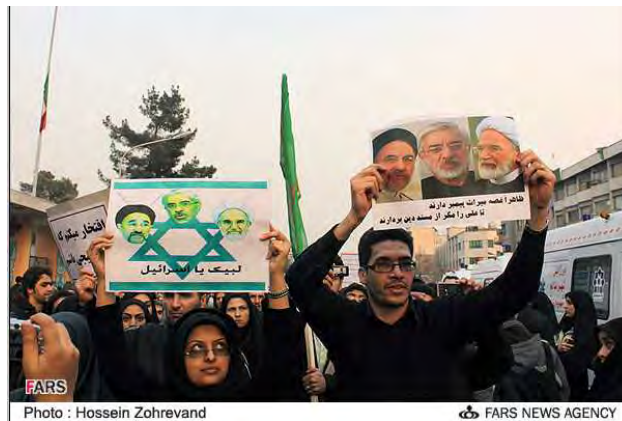
Демонстрация в поддержку режима (29 декабря 2009 года) На снимке запечатлены участники демонстрации, несущие плакаты с фотографиями трёх лидеров движения протеста: Мира Хусейна Мусави, Махди Круви и Мухаммада Хатами, расположенными на трёх вершинах Звезды Давида. Надпись под изображением: "Они любят Израиль".