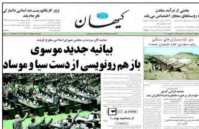
Центральный заголовок в газете "Кихан": новое открытое письмо Мусави написано под диктовку агентов ЦРУ и Моссادا (газета "Кихан", 2 января 2010 года)