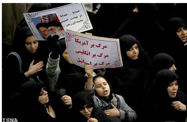
Внизу: участники демонстрации 29 декабря несут плакаты с надписями на языке фарси "Смерть Америке", "Смерть Британии", "Смерть Израилю". Вверху: транспарант с текстом, прославляющим Хомейни и продолжателя его дела Хаминаи

4. Обвинения в адрес лидеров движения протеста были особенно резкими в ходе демонстрации в поддержку режима, организованной иранскими властями 29 декабря 2009 года. Целью этой демонстрации было создать впечатление, что иранский народ поддерживает своего лидера и исламский режим. В ходе демонстрации, к участию в которой были обязаны работники министерств и других правительственных учреждений, раздавались плакаты с изображениями троих лидеров движения протеста на трёх вершинах Звезды Давида. Также в ходе этой демонстрации её участники выкрикивали такие лозунги, как "Смерть Круви", "Смерть (Миру Хусейну) Мусави", "Смерть Хатами", а также "Смерть двуличным" (презрительное прозвище членов оппозиционной организации "Моджахеддин Халак"). Наряду с этими лозунгами в ходе "эпической", как её называли иранские государственные СМИ, заявившее, что "число её участников измеряется миллионами", демонстрации в поддержку режима, скандировались и были написаны на плакатах обычные лозунги: "Смерть Америке", "Смерть Британии" и "Смерть Израилю". В дополнение к этому в ходе демонстрации скандировались лозунги "Смерть трём Хусейнам: Саддаму (Хусейну), Бараку (Хусейну) Обаме и Миру (Хусейну) Мусави" 1 (студенческое агентство новостей ISNA, Иран, 29 декабря).