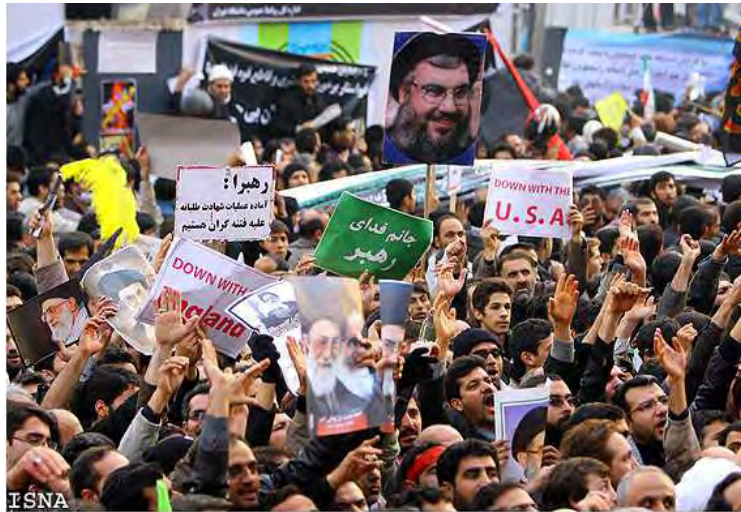
Портреты Хасана Насраллы (сверху в центре) и транспаранты с выражениями поддержки лидера Ирана и осуждения США (FARS, 29 декабря 2009 года)