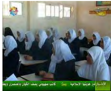
Une délégation de la faction du Hamas au Conseil Législatif Palestinien visite des écoles dans la bande de Gaza au début de la nouvelle année scolaire (Télévision Al-Aqsa, le 23 août 2009).