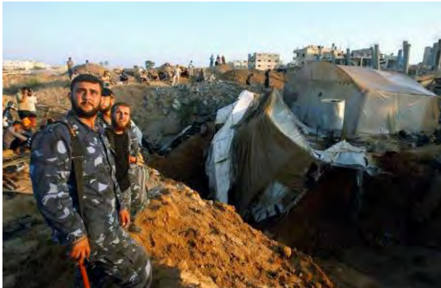
Forces de sécurité du Hamas gardant le tunnel de contrebande frappé par l'armée de l'air israélienne le 24 août. L'attaque a été lancée en riposte aux obus de mortier tirés en territoire israélien (Ibrahim Abu Mustafa, Reuters, 25 août 2009)