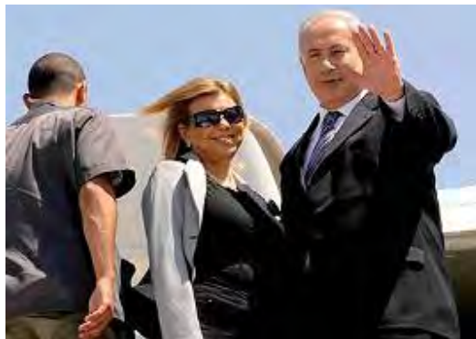
Départ du Premier ministre Benjamin Netanyahu pour Londres avant une rencontre avec l'envoyé spécial américain George Mitchell (Photo: Amos Ben-Gershon, bureau de presse du gouvernement, 24 août 2009)

■ Le 23 août, au cours d'une réunion du gouvernement à la veille de son départ pour la Grande-Bretagne et l'Allemagne en vue de pourparlers diplomatiques et d'une rencontre avec l'envoyé spécial américain George Mitchell, le Premier ministre israélien Benjamin Netanyahu a déclaré que les Américains et d'autres acteurs de la politique internationale, de même que les Israéliens, souhaitaient une reprise des pourparlers avec les Palestiniens. De manière générale, a-t-il précisé, cela pourrait avoir lieu d'ici la fin du mois de Septembre, mais cela dépend d'accords entre Israël et les Américains et bien sûr avec les Palestiniens. Il a ajouté qu'il existait toujours des points de "désaccord" et que le degré d'implication des pays arabes dans le processus de paix était incertain (Site Internet du Cabinet du Premier ministre israélien, 23 août 2009).