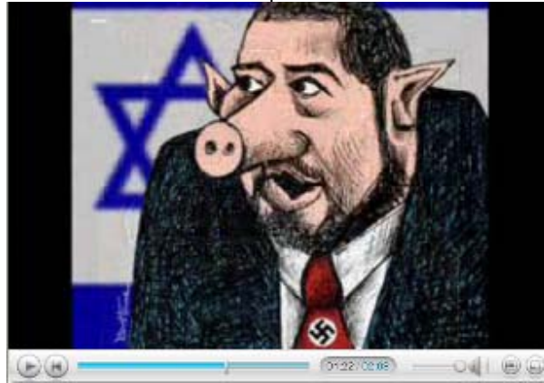
Le ministre des Affaires étrangères représenté comme un porc avec une croix gammée sur sa cravate