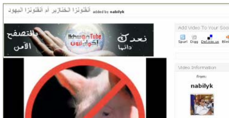
La vidéo intitulée "Grippe porcine ou grippe des Juifs"

4. Le site Internet des Frères Musulmans, mouvement égyptien dont le Hamas a fait scission il y a environ deux décennies, a publié une vidéo antisémite intitulée " La grippe porcine ou la grippe des Juifs " (30 avril 2009). La vidéo associe la grippe porcine aux Juifs et montre le ministre israélien des Affaires étrangères Avigdor Lieberman sous les traits d'un porc. 3