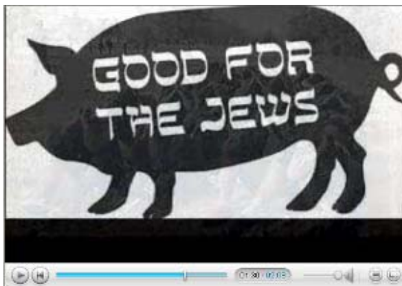
Porc sur lequel il est écrit "Bon pour les Juifs" (Du site Internet des Frères Musulmans, fondateurs du Hamas)