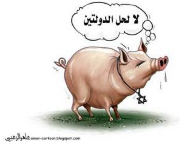
Caricature d'Akhbar al-Arab, publié aux EAU, montrant un porc portant une étoile de David et disant "Non à la solution à deux Etats" (1 er mai 2009)

6. Selon un article du Palestinien Sami al-Akhras , publié sur le site Internet "Al-Tajdid al-Arabi" ("l'innovation arabe") le 1 er mai 2009, 4 "Nous [les Arabes] n'avons aucun porc parmi nous à part les Juifs israéliens... Leur présence représente une grippe qui est plus dangereuse et puissante que la grippe porcine actuelle et malheureusement, nous devons encore trouver le sérum qui arrêtera la diffusion de la grippe juive..."