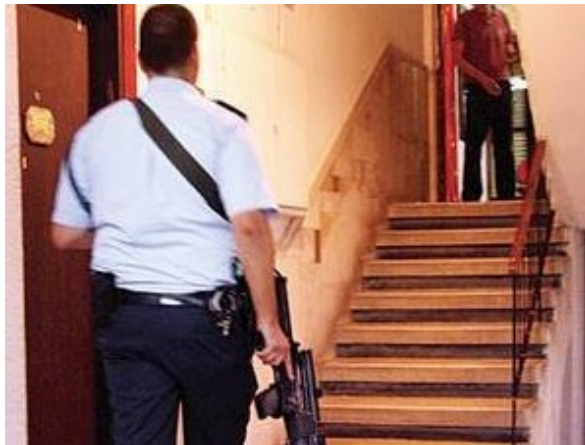
Recherche du suspect soupçonné d'avoir poignardé un soldat à Ramat Gan le 3 mai