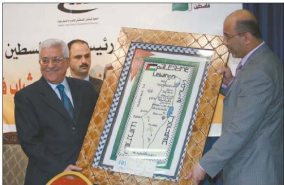
Abu Mazen reçoit la carte de la Palestine (Al-Hayat al-Jadeeda, 28 avril 2009)