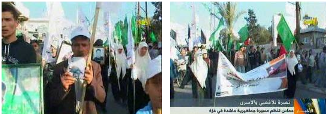
Défilé à l'occasion de la "Journée du prisonnier" dans la bande de Gaza (Télévision Al-Aqsa, 16 avril 2009)

■ Le 17 avril, la "Journée du prisonnier palestinien" a été célébrée dans les territoires sous administration palestinienne. Des rassemblements et des cortèges ont été organisés en Judée-Samarie ainsi que dans la bande de Gaza. La question de l'échange de Gilad Shalit, le soldat franco-israélien enlevé, contre des prisonniers palestiniens a de nouveau été soulevée. Les porte-parole du Hamas ont déclaré dans des discours qu'ils ne reverraient pas à la baisse les demandes soumises à Israël. Ils ont également menacé d'enlever d'autres soldats israéliens si aucun progrès n'était réalisé dans l'accord sur l'échange de prisonniers.