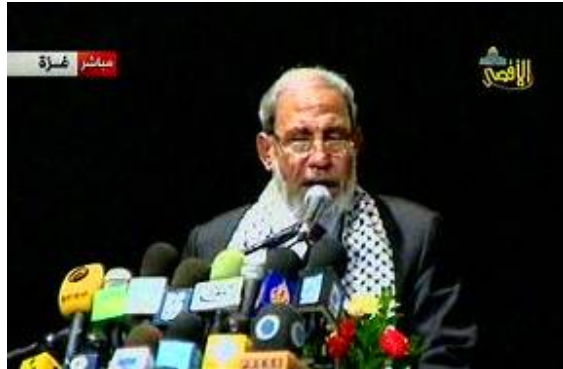
Mahmoud al-Zahar à une manifestation à l'occasion de la Journée du Prisonnier (Télévision Al-Aqsa, 18 avril 2009)