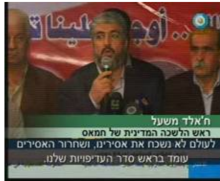
Khaled Mashaal au camp de réfugiés d'Al-Yarmuk en Syrie : "Nous n'oublierons jamais nos prisonniers et leur libération est notre priorité absolue..." (Al-Jazeera, 20 avril 2009)