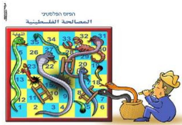
La réconciliation palestinienne vue par les Jordaniens (Al-Ghad, 8 avril 2008)