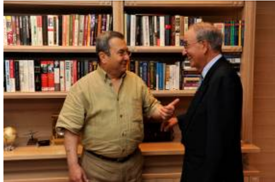
Gauche: Benjamin Netanyahu serrant la main de George Mitchell. Droite: George Mitchell et Ehud Barak.

■ Lors de ces rencontres le désaccord fondamental sur la solution à deux Etats qui a émergé au sommet d'Annapolis a été à nouveau soulevé: 1