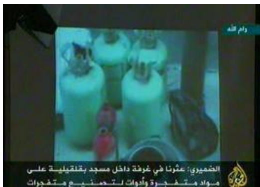
Bouteilles de gaz trouvées dans un laboratoire d'explosifs au sous-sol d'une mosquée à Qalqiliya (Al-Jazeera, 14 avril 2009)