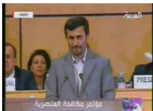
Ahmadinejad à la conférence de Durban II (Al-Arabia, 20 avril 2009)

■ Le 20 avril, la conférence de Durban II s'est ouverte à Genève, en présence du Président iranien Ahmadinejad. Pendant son discours, prononcé à la veille de la Journée du souvenir de l'Holocauste, la plupart des représentants des pays de l'Union Européenne ont quitté la salle. Le Président français a vilipendé Ahmadinejad pour son discours, le qualifiant "d'intolérable". Le Secrétaire Général de l'ONU, qui s'était entretenu avec Ahmadinejad avant son discours, s'est déclaré désolé que le forum soit utilisé pour provoquer des désaccords. Suite à la rencontre d'Ahmadinejad avec le Président suisse, Israël a rappelé son ambassadeur en Suisse pour consultation.