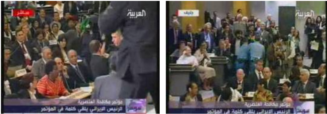
Diplomates de l'Union Européenne quittant la salle pendant le discours d'Ahmadijad (Al-Jazeera, 21 avril 2009)