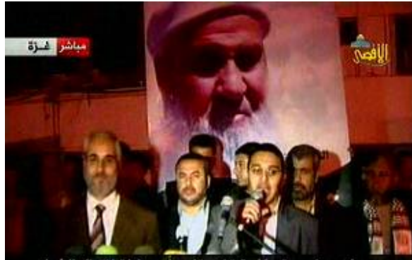
Manifestation en soutien à al-Bitawi organisé dans la bande de Gaza (Télévision Al-Aqsa, 19 avril 2009)

avril 2009). Ismail Haniya , le chef de l'administration de facto du Hamas a condamné l'incident, le qualifiant de "crime méprisable, terrible" (Télévision Al-Aqsa, 20 avril 2009).