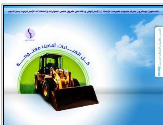
Poster du Hamas en l'honneur des manifestations organisées pour "Jérusalem, capitale de la culture arabe," encourageant les attaques au bulldozer (Forum du Hamas, 7 mars 2009)