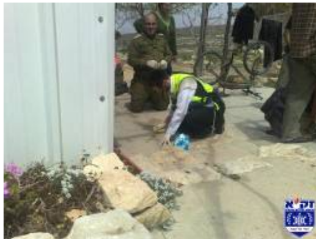
Scène de l'attaque terroriste dans la localité de Bat Ayn dans le Goush Etzion, au Nord de Jérusalem (2 avril 2009)