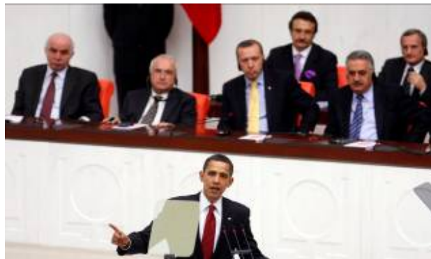
Le Président Obama devant le Parlement turc (Jim Young, Reuters, 6 avril 2009)

fortement l'objectif de deux Etats, Israël et la Palestine , vivant côte à côte dans la paix et la sécurité. C'est un but partagé par les Palestiniens, les Israéliens et les personnes de bonne volonté dans le monde entier. C'est un objectif que les partis ont accepté dans la feuille de route et à Annapolis. C'est un but que je poursuivrai activement en tant que Président des Etats-Unis. Nous savons que la route sera difficile. Les Israéliens comme les Palestiniens doivent prendre des mesures qui sont nécessaires pour construire la confiance. Les Israéliens et les Palestiniens doivent vivre en accord avec les engagements qu'ils ont pris. Tous deux doivent surmonter des passions de longue date et la politique du moment pour faire des progrès vers une paix sûre et durable" (AP, 6 avril 2009).