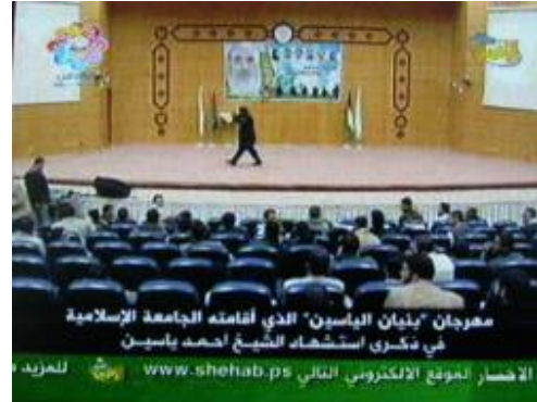
Scènes de la pièce. A gauche : un père juif à son fils, "Nous devons laver nos mains dans le sang musulman." A droite : le père dit, "Les Juifs détestent les musulmans. Les juifs aiment tuer les musulmans" (Télévision Al-Aqsa, 3 avril 2009).

■ Le 25 mars, Mahmoud al-Zahar , haut responsable du mouvement dans la bande de Gaza, a donné une conférence devant des activistes dans le camp de réfugiés d'Al-Yakmuk en Syrie. Il a demandé pourquoi, tout au long de l'histoire, les Juifs avaient été massacrés . Sa réponse a été que ce qui est arrivé dans la bande de Gaza (l'Opération Plomb Durci) fournissait une réponse à la question [cf., justifiant le massacre de Juifs]. Au sujet du dialogue palestinien interne, il a dénoncé les tentatives pour forcer le Hamas à reconnaître Israël, et a déclaré que "celui qui parmi nous reconnaît Israël se fera couper la langue. La reconnaissance d'Israël revient à vous priver de votre droit et du droit de vos enfants de rentrer en Palestine. La reconnaissance d'Israël signifie que vous renoncez à Jérusalem pour toujours." Il a également appelé l'OLP "à se lever de la tombe et à porter de nouveau les vêtements de la résistance" [cf., à adopter une politique de violence et de terrorisme] pour libérer la Palestine (Télévision Al-Aqsa, 31 mars 2009).