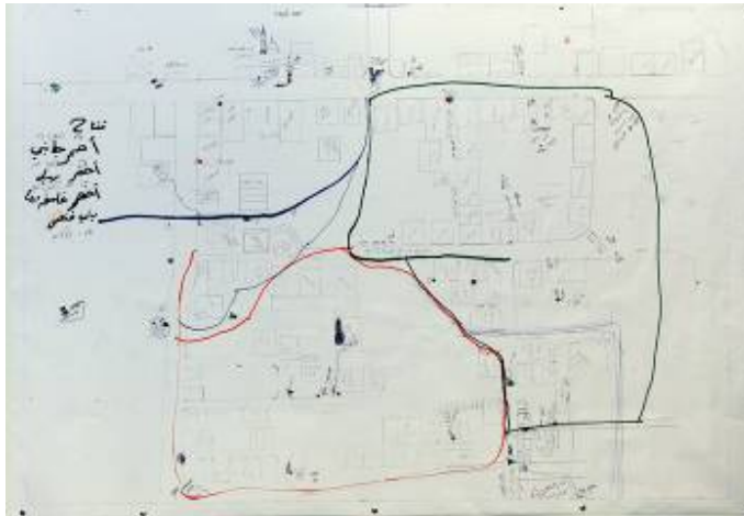
Croquis du secteur d'Al-Atatra (Porte-parole de Tsahal, 8 janvier 2009)

5. Selon le croquis, le Hamas a divisé le quartier en trois zones de combat et les a marquées en bleu, rouge et vert. On peut voir divers types d'engins piégés dans chaque zone : charges inclinées, barils piégés, charges de côté, mines anti-personnel et antichar, le tout disséminé dans tout le quartier.