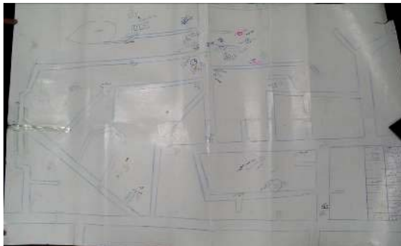
Croquis des positions et des armes à Beit Lahiya

2. Le croquis de la région de Beit Lahiya montre plusieurs rues et une mosquée. Des positions de tir, des positions antichars et des sites où divers engins piégés ont été placés sont marqués. Certains des équipements ont été installés près de logements résidentiels.