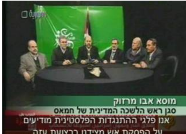
Le Hamas accepte le cessez-le-feu. Musa Abu Marzuq : "Nous, les factions de la résistance palestinienne, annonçons un cessez-le-feu dans la bande de Gaza..." (Télévision Al-Arabiya, 14h 18 janvier 2009)