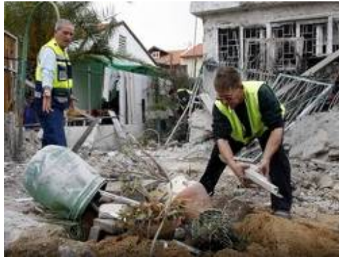
Tir de roquette sur Ashdod (Edi Israel, NRG, 18 janvier 2009)