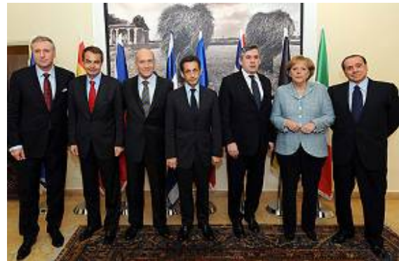
A gauche : conférence de presse organisée après la conférence de Sharm el-Scheik (Télévision Al-Jazeera en anglais, 18 janvier 2009). A droite : Après la conférence, les dirigeants européens se sont rendus à Jérusalem (Service de presse du gouvernement israélien, 18 janvier 2009)