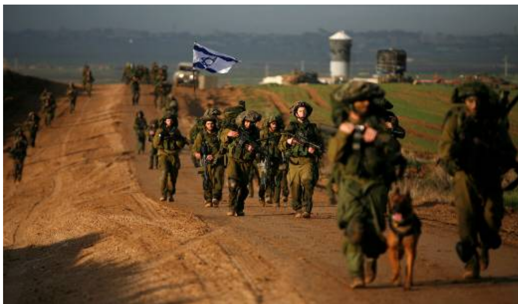
Les soldats de Tsahal quittent la bande de Gaza après l'annonce du cessez-le-feu par Israël (18 janvier 2009)