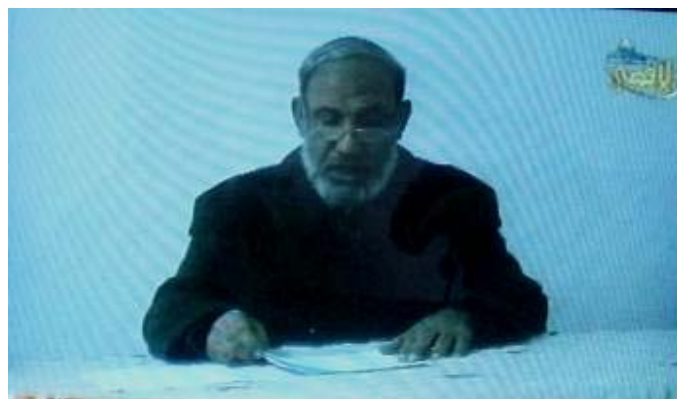
Rare apparition de Mahmoud Al-Zahar sur la chaîne de télévision Al-Aqsa (l'image est de mauvaise qualité technique). Lisant un discours rédigé, il a déclaré que "les roquettes 'de la résistance' fabriquées de nos mains ont défilé la théorie de la sécurité israélienne (Télévision Al-Aqsa, 5 janvier 2009)

■ Les journaux du Hamas Al-Risala et Felesteen , tous deux publiés dans la bande de Gaza, ont cessé leur publication (Felesteen, 4 janvier 2009). La chaîne Al-Aqsa continue à émettre, mais sa qualité est faible. La chaîne Al-Quds , qui émet de l'extérieur de la bande de Gaza, fonctionne comme d'habitude. La plupart des sites Internet du Hamas fonctionnent, mais le plus important des sites utilisé par les Brigades Izz al-Din al-Qassam a cessé ses émissions le 4 janvier. En résumé, l'appareil de propagande du Hamas n'a été endommagé jusqu'ici que partiellement, mais il continue néanmoins à envoyer ses messages à de nombreux téléspectateurs via la chaîne qatarie Al-Jazeera, qui comme d'habitude, sert l'effort de propagande du Hamas.