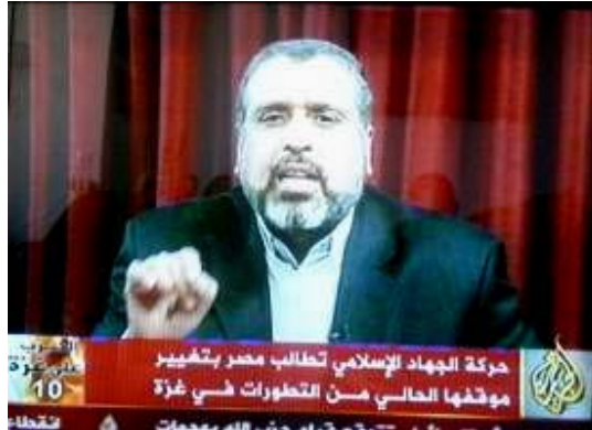
Le responsable du JIP à Damas Ramadan Shallah : "Les forces internationales envoyées dans la bande de Gaza seront attaquées" (Télévision Al-Jazeera, 5 janvier 2009)