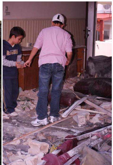
Frappe directe sur une maison de Sderot (Zeev Trachtman, 4 janvier 2009)