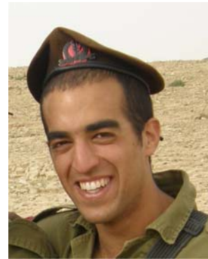
Dvir Emanuelof (Porte-parole de Tsahal, 4 janvier 2009)

■ Au cours des dix jours de l'Opération Plomb Durci, trois civils israéliens et un soldat ont été tués et plus de 100 autres ont été blessés, dont dix grièvement.