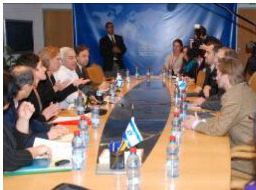
La ministre israélienne des Affaires étrangères Tzipi Livni et les représentants des organismes d'aide humanitaire opérant à Gaza (Ministère israélien des Affaires étrangères, 4 janvier 2009)

■ La ministre des Affaires étrangères a annoncé aux responsables des dites agences, la création d'un nouveau QG d'opérations humanitaires commun au ministère des Affaires étrangères et au coordinateur des activités du gouvernement dans les territoires, dont la tâche sera de traiter les demandes humanitaires des diverses agences et d'aider à trouver des solutions aux problèmes. Les représentants des agences ont salué cette initiative et ont appelé à une coopération supplémentaire pendant l'opération.