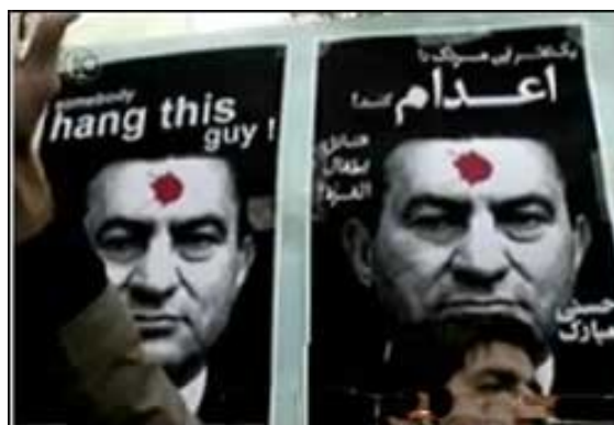
Affiches appelant à pendre le Président égyptien Hosni Mubarak (Iran Press News, 5 janvier 2009)