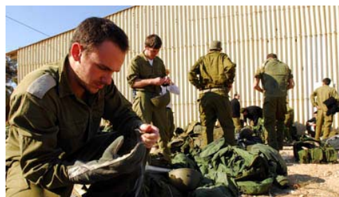
Des réservistes se préparent à entrer à Gaza (Porte-parole de Tsahal, 4 janvier 2009)