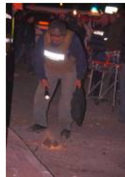
Déplacement d'une roquette tombée au centre de Sderot (Zeev Trachtman, 4 janvier 2009)

■ Au cours des 24 heures écoulées, 30 roquettes se sont abattues en territoire israélien, dont trois Grad de 122mm et sept obus de mortier. Plusieurs engins sont tombés dans et autour d'Ashdod, d'Ashqelon et de Sderot. Trois civils ont été blessés et 11 ont été soignés pour choc ; des dégâts considérables ont été signalés. De plus, un nombre important d'obus de mortier ont été tirés sur les forces de Tsahal opérant dans la bande de Gaza. Depuis le début de l'Opération Plomb Durci, 325 roquettes et 122 obus de mortier se sont abattus en territoire israélien.