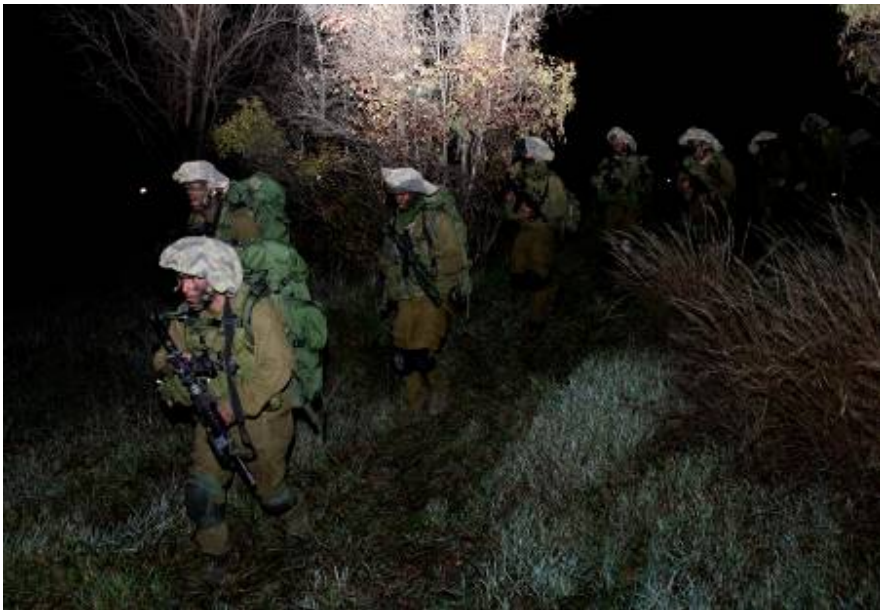
Soldats de Tsahal en route pour l'offensive terrestre dans la bande de Gaza (Baz Ratner, Reuters, 3 janvier 2009)