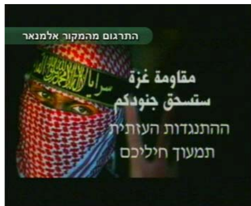
Clip diffusé sur la chaîne Al-Manar du Hezbollah : "La résistance gazaouite écrasera vos soldats" (Al-Manar, 5 janvier 2009)

■ Les Syriens poursuivent leurs contacts politiques avec leur allié, l' Iran . Ali Larijani, le chef du Parlement iranien, est supposé se rendre en Syrie et au Liban pour discuter des événements de Gaza. Sa visite a été précédée par celle de Saeed Jalili, le secrétaire de Conseil de sécurité nationale iranien, qui s'est rendu en Syrie et a rencontré ses dirigeants (ISNA, 3 janvier 2008). Les médias syriens continuent de largement couvrir l'opération de Tsahal dans la bande de Gaza et à diffuser des programmes anti-israéliens, montrant des photos des victimes.