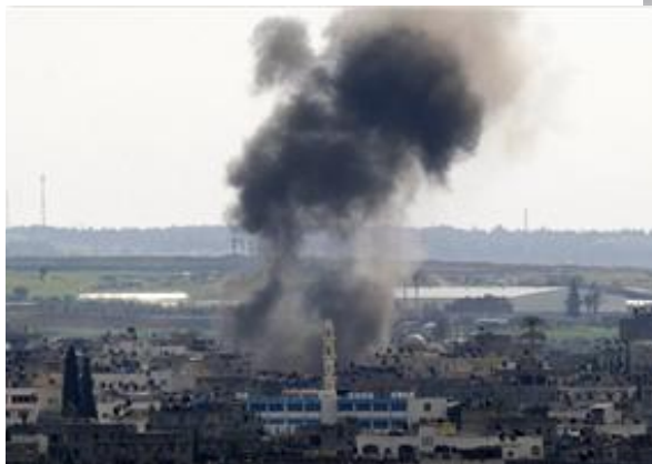
Frappe de l'armée de l'air israélienne sur la ville de Gaza (Palestine-info, 29 décembre 2008)