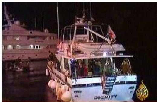
Le navire Dignity avant son départ de Chypre le 29 décembre

18. Dans la nuit du 29-30 décembre, le navire Dignity a quitté Chypre pour se rendre dans la bande de Gaza. En s'approchant de la bande de Gaza, des navires israéliens lui ont demandé de s'identifier. Il n'a pas répondu et a pris un virage sec, entrant en collision avec le bateau israélien, ce qui a légèrement endommagé les deux navires. Après la collision, le Dignity a répondu aux appels et a commencé à naviguer en direction de Chypre. Les navires israéliens l'ont escorté, offrant leur aide en cas de défaillance (Porte-parole de Tsahal, 30 décembre 2008).