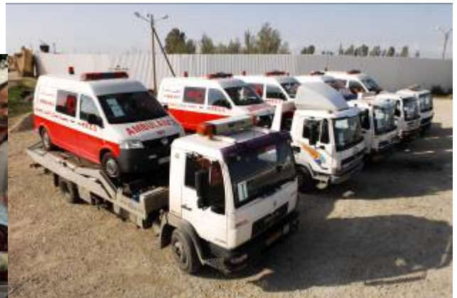
Le 29 décembre, Israël a permis l'acheminement de plus de 60 camions et de 10 ambulances dans la bande de Gaza par le terminal de Kerem Shalom (Porte-parole de Tsahal, 29 décembre 2008)