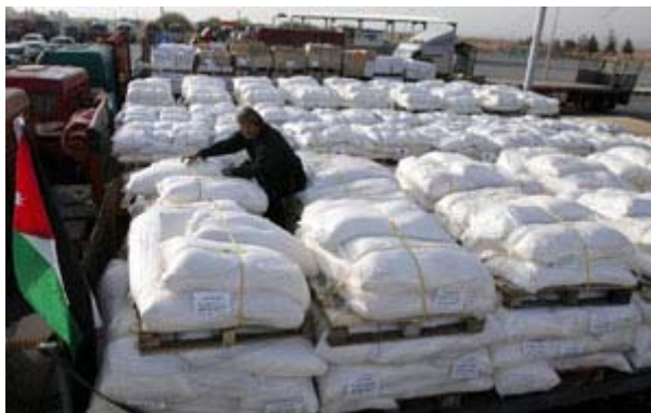
Chargement de vivres au terminal de Rafah le 29 décembre (Al-Hayat al-Jadida, 30 décembre 2008)

15. Le 29 décembre dans l'après-midi, le terminal de Rafah a été ouvert et l'Egypte a permis le passage de plusieurs douzaines de camions transportant de l'aide pour la bande de Gaza. L'aide provient d'Egypte, du Qatar, d'Arabie Saoudite et de la Libye . Par ailleurs, des douzaines de blessés ont commencé à être évacués de la bande de Gaza pour recevoir un traitement médical en Egypte (Médias arabes, 29 décembre 2008).