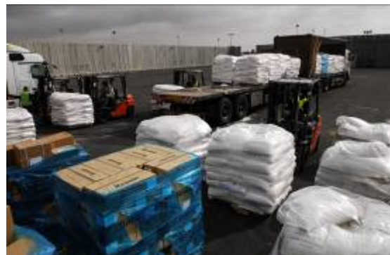
Camions d'aide humanitaire entrant dans la bande de Gaza (Porte-parole de Tsahal, 29 décembre 2008)