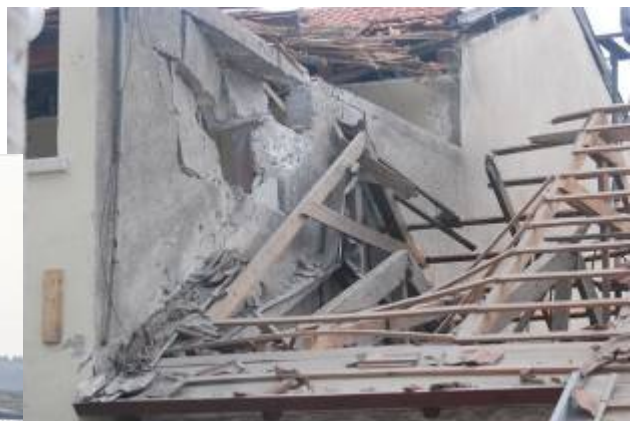
Frappe directe d'une roquette sur une maison de Sderot (Sderot Media Center, Hamutal Ben- Shetrit, 30 décembre 2008)