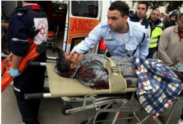
Blessé évacué d'un chantier à Ashkelon après un tir de roquette. Une personne a été tuée et plusieurs autres ont été blessées