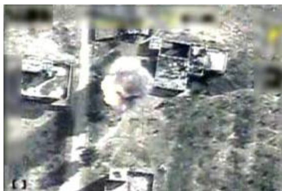
Attaque d'un camion chargé de roquettes Grad (Porte-parole de Tsahal, 29 décembre 2008). Pour voir une vidéo de l'attaque, cliquez ici http://www.terrorism-info.org.il/malam_multimedia/English/eng_n/html/grad.htm .

7. L'armée de l'air a attaqué un camion du Hamas chargé de douzaines de roquettes Grad dans la région de Jabalia (au Nord de la bande de Gaza). Le camion a été touché et les roquettes ont explosé. Il s'avère que le Hamas voulait transporter les roquettes d'un bâtiment où elles étaient stockés vers un emplacement sûr, de crainte que le bâtiment ne soit attaqué par Tsahal, ou les rapprocher d'aires de lancement d'où elles auraient été tirées sur des centres urbains israéliens (Site Internet du porte-parole de Tsahal, 29 décembre 2008).