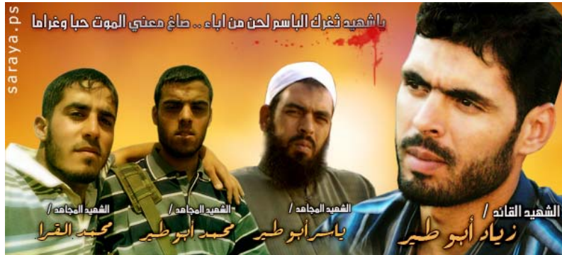
Affiche des « Bataillons de Jérusalem », la branche armée du Jihad Islamique Palestinien, commémorant la mort des membres de l'organisation, dont le plus important (à droite) Ziad Abu Tir (Site Internet des Bataillons de Jérusalem, 30 décembre 2008)