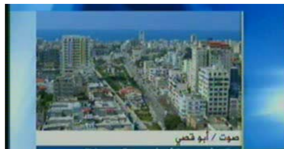
A gauche : la roquette tirée par les Brigades des Martyrs d'Al-Aqsa (Télévision Al-Alam, 26 juin 2008). A droite : revendication de la responsabilité par téléphone (Télévision Al-Jazeera, 26 juin 2008).

5. Le 27 juin, deux obus de mortier ont été tirés sur le terminal de Karni ainsi qu'un autre le 28 juin sur ce même terminal. Il n'y a eu ni blessé ni dégât. Aucune organisation n'a revendiqué ces attaques.