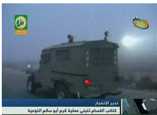
Jeep similaire à un véhicule de Tsahal utilisée par les terroristes lors de l'attaque de Kerem Shalom (Télévision Al-Aqsa, 19 avril 2008).