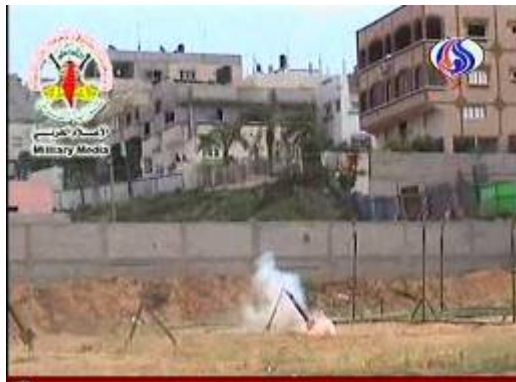
Roquettes du Jihad Islamique Palestinien tirées à proximité immédiate d'un quartier résidentiel (Télévision Al-Alam, 20 avril 2008).

■ Durant la semaine écoulée, le nombre de roquettes et d'obus de mortier tirés sur les localités israéliennes du Néguev occidental a largement augmenté. Un total de 71 roquettes a été tiré, contre neuf la semaine précédente. La plupart des engins ont visé Sderot. Le 21 avril, une roquette s'est abattue près d'une voiture dans le kibboutz Gevim, blessant sérieusement un enfant de quatre ans. Les Palestiniens ont également tiré sur des ouvriers agricoles ramassant des pommes de terre dans les champs du kibboutz Nir Oz.