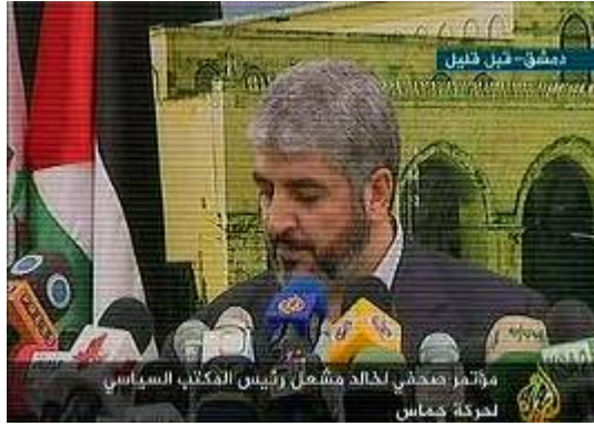
Khaled Mashal s'exprime au sujet du soldat israélien détenu en otage Gilad Shalit (Télévision Al-Jazeera, 21 avril 2008).

■ Pendant sa visite, Carter a critiqué la position isolationniste adoptée par les Etats-Unis et Israël envers le Hamas, et a déclaré qu'il y avait très peu de chance de parvenir à un accord de paix si un acteur important comme le Hamas n'y prenait pas part. Un porte-parole du Département d'Etat américain a déclaré que les Etats-Unis ne voyaient aucun changement dans la position du Hamas, caractérisée par le terrorisme et la violence. Les Etats-Unis ont insisté sur leurs positions, affirmant que tant que le Hamas ne reconnaîtra pas le droit de l'Etat Israël à exister, il n'y aura aucune base pour des négociations (Site Internet du Département d'Etat américain, 18 avril 2008).