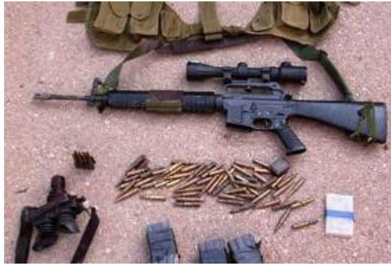
Armes trouvées sur les corps de Bilal Salah et de son collaborateur (Porte-parole de Tsahal, 17 avril 2008)