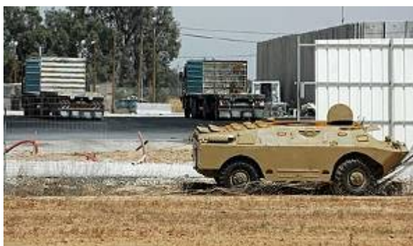
Un transporteur de troupes blindé de type BRDM confisqué aux forces de sécurité d'Abu Mazen par le Hamas et utilisé dans l'attaque du terminal de Kerem Shalom (19 avril 2008).