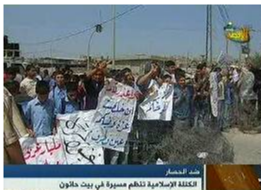
Cortège de protestation contre le blocus à Beit Hanoun (Télévision Al-Aqsa, 21 avril 2008).