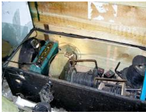
Armes trouvées durant une opération de Tsahal dans une mosquée dans le quartier de Sajaiya (Porte-parole de Tsahal, 16 avril 2008).

■ Le 16 avril au matin, une unité de Tsahal opérant le long de la barrière frontalière près du kibboutz Be'eri (à 4 km au Sud-Ouest du terminal de Karni) ont identifié deux Palestiniens armés qui tentaient de déposer des engins piégés près de la barrière de sécurité. Afin de déjouer leurs plans, les soldats sont entrés dans la bande de Gaza et ont été pris en embuscade par un groupe de six terroristes. Les Palestiniens, qui étaient dissimulés, ont ouvert le feu sur les soldats, profitant du brouillard recouvrant le secteur. Lors des échanges de tirs, trois soldats de Tsahal ont été tués et trois autres ont été blessés. Les terroristes ont apparemment réussi à s'échapper dans la bande de Gaza. Le Hamas a revendiqué la responsabilité de l'attaque. 1