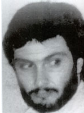
IMAD FAYEZ MUGNIYEH