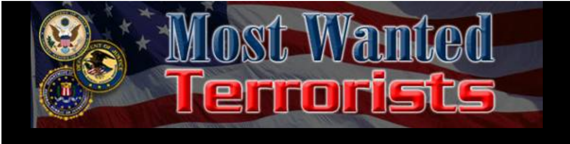
IMAD FAYEZ MUGNIYAH

Imad Moughnieh: terroriste de haut rang recherché par le FBI (extrait du site Internet du FBI)