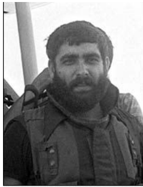
Hajj Imad Fayed Moughnieh, commandant militaire et terroriste international (Al-Nahar, 17 février 2002).

5. Les données biographiques sur Moughnieh sont rares, puisqu'il était extrêmement prudent et conservait ses allers et venues ainsi que ses activités secrètes. Imad Fayed Moughnieh, surnommé Hajj Radwan par ses partisans au sein du Hezbollah, était un Musulman chi'ite, né le 12 juillet 1964 dans le village de Tayir Debba à l'Est de Tyr au Sud du Liban. Ces dernières années, il passait son temps entre Beyrouth, l'Iran et la Syrie, centres d'activités du Hezbollah.