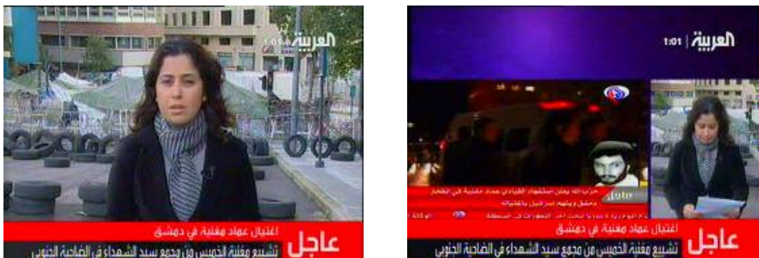
Gauche: reportage en direct de la scène de l'explosion à Damas. Droite: Photo du lieu de l'explosion (Télévision Al-Arabiya, 13 février 2008).

1. Vers 22h00 le 12 février, une voiture a explosé dans le quartier de Soussa à Damas. L'explosion a tué Imad Moughnieh, personnalité importante du Hezbollah, et son garde du corps. Le 13 février au matin, le Hezbollah a officiellement annoncé sa mort et a accusé Israël de l'avoir tué. L'organisation a également insisté sur la nécessité de poursuivre sa "voie du jihad" (Télévision Al-Manar, 13 février 2008). Ses obsèques ont eu lieu le 14 février (Télévision Al-Jazeera, 13 février 2008).