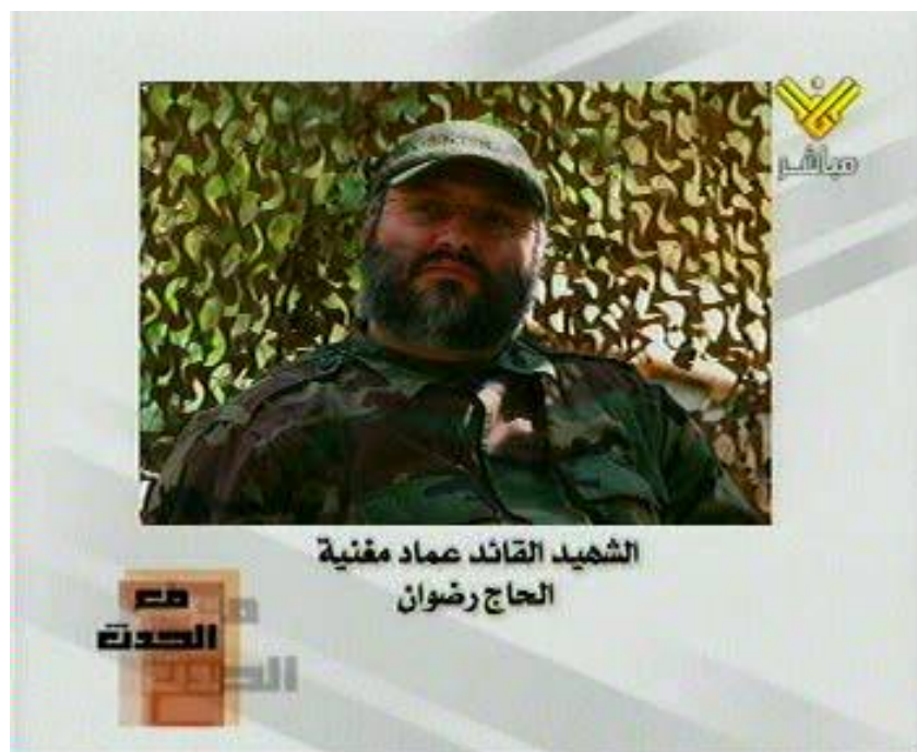
Rare photo de Moughnieh (Al-Hajj Radwan) publiée après sa mort (Télévision Al-Manar, 13 février 2008).

Imad Fayez Moughnieh, n° 2 du Hezbollah et responsable de ses opérations militaires et terroristes au Liban et à l'étranger, est mort dans l'explosion de son véhicule à Damas. Moughnieh était impliqué dans de multiples attaques terroristes visant Israël, des cibles juives et occidentales, et figurait dans la liste des terroristes les plus recherchés par les Etats-Unis.