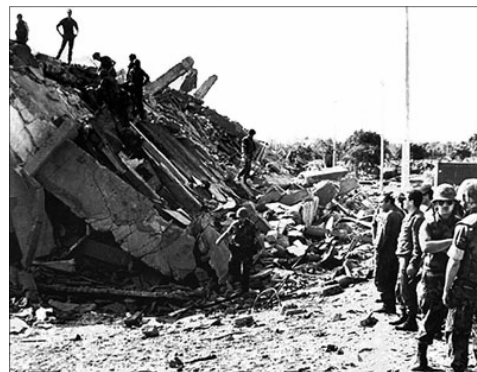
L'attaque contre le siège du commandement de la marine à Beyrouth en 1982: avant et après.