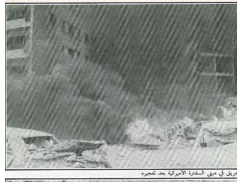
Images de l'attaque contre l'ambassade américaine de Beyrouth en 1982, extraites du livre (en arabe) "Opérations suicide", publié à Beyrouth en Novembre 1985.

2) L'attaque contre le siège du commandement de la marine américaine à Beyrouth: un camion portant 5,450 kilogrammes de TNT a franchi la porte du camp, est entré dans le bâtiment principal et a explosé. L'explosion a détruit le bâtiment et a provoqué la mort de 241 Marines (Octobre 1983) 2