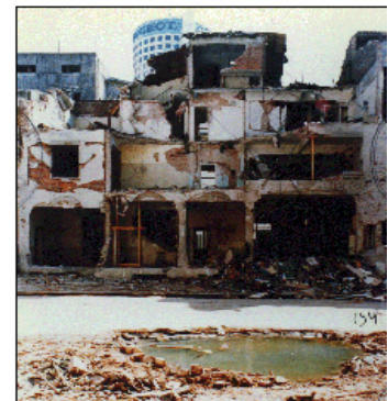
Cibles d'attaques terroristes juives et israéliennes en Argentine: l'ambassade israélienne et le bâtiment de l'AMIA à Buenos Aires après les attaques.