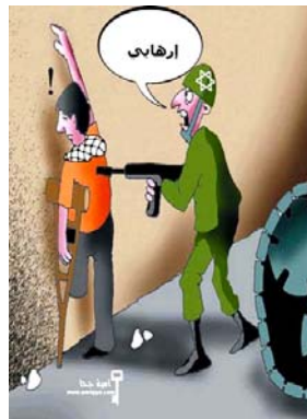
Un soldat israélien dépeint sous les traits d'un Juif stéréotypé menace un invalide palestinien unijambiste et l'appelle "terroriste" (Al-Hayat Al-Jadeeda, 20 mai 2006).