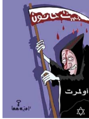
Le Premier ministre israélien Ehud Olmert sous les traits du diable. Le texte sur sa faux précise "Beit Hanoun" (Al-Hayat Al-Jadeeda, 5 novembre 2006). Le dessin se réfère aux activités contre-terroristes de Tsahal au Nord de la bande de Gaza.