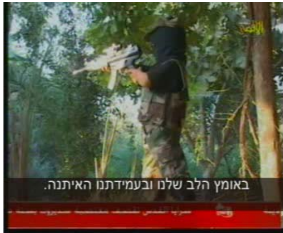
Ahmed, l'expert en jihad (Télévision Al-Aqsa, 3 septembre 2007)