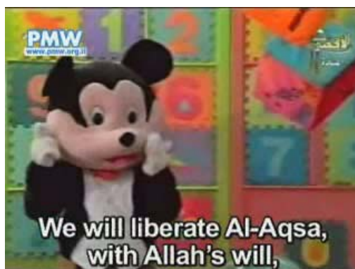
La marionnette de Mickey Mouse dans le programme “Les Pionniers de Demain” (Télévision Al-Aqsa, 10 mai 2007 – avec l’aimable autorisation de Palestinian Media Watch)

5. Un de ces programmes, intitulé “Les Pionniers de Demain” (Mai 2007), recourait à la marionnette de Mickey Mouse (surnommé farfour 1 ). Le programme prêchait l'idéologie du Hamas aux enfants, et notamment la prise de contrôle islamique du monde, la poursuite des violences et du terrorisme ("résistance") contre Israël jusqu'à sa destruction, "la libération de la mosquée Al-Aqsa", l'incitation à la haine envers Israël et la "libération" de l'Irak ainsi que des autres pays arabo-musulmans "envahis par des meurtriers." 2 Un autre programme diffusé en Septembre 2007, avant la rentrée scolaire, mettait en scène un enfant spécialiste du jihad ("guerre sainte"). 3