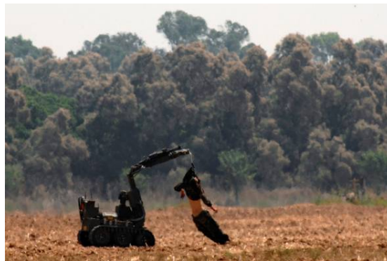
Un robot de Tsahal évacue les corps des terroristes (Amir Cohen pour Reuters, 25 août 2007)

2. Une fois sur le sol israélien, les deux terroristes ont tiré sur un soldat posté devant les locaux du bureau de liaison près du terminal d'Erez. Le soldat a riposté aux tirs. Les terroristes ont continué d'avancer en direction de Netiv Ha'asara. Des soldats de Tsahal arrivés sur les lieux ont tué les terroristes à quelques centaines de mètres de là. Les assaillants étaient revêtus d'uniformes de Tsahal. Des armes légères, des grenades et deux engins explosifs ont été trouvés en leur possession. Deux soldats de Tsahal ont été légèrement blessés au cours de cet incident.