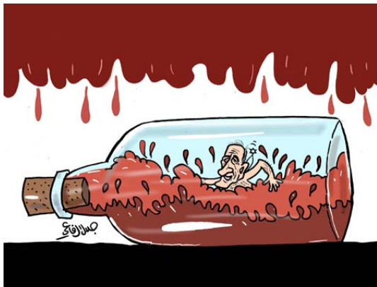
Ehud Olmert nage dans une rivière de sang (Jalal al-Rifa'i, Ad-Dustour, 15 juillet 2006)