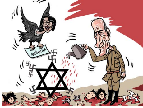
Ehud Olmert arrose une étoile de David sur laquelle poussent des croix gammées. Sous l'étoile de David, on aperçoit des corps d'enfants. La secrétaire d'Etat américaine Condoleezza Rice est représentée sous les traits d'un vautour portant une lettre titrée "Un nouveau Proche-Orient" (Jalal al-Rifa'i, Ad-Dustour, 31 juillet 2006).