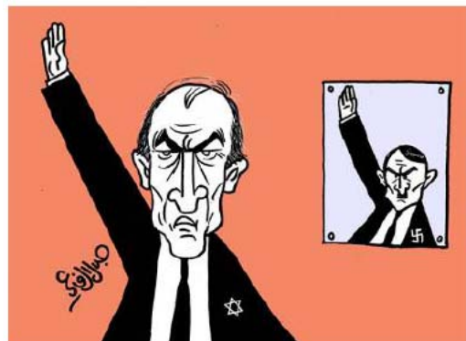
Ehud Olmert et Hitler font le salut nazi (Jalal al-Rifa'i, Ad-Dustour, 13 avril 2006)