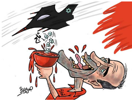
Ehud Olmert boit du sang dans laquelle un avion israélien fait tomber des glaçons (Jalal al-Rifa'i, Ad-Dustour, 15 juin 2006)