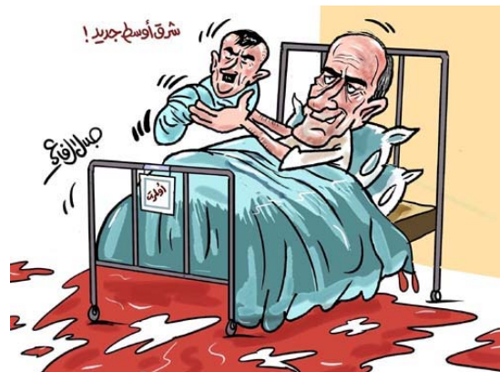
Ehud Olmert donne naissance à un bébé-Hitler; la légende précise: "Un nouveau Proche-Orient" (Jalal al-Rifa'i, Ad-Dustour, 26 juillet 2006)