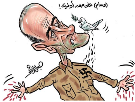
Le Premier ministre israélien Ehud Olmert aux mains ensanglantées; la colombe de la paix fait ses besoins sur lui, en forme de croix gammée. La légende précise: "Décoration [croix gammée] sur l'épaule d'Olmert" (Jalal al-Rifa'i, Ad-Dustour, 5 août 2006)