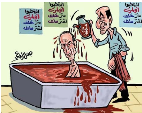
Ehud Olmert prend un bain de sang et l'ancien Ministre israélien de la Défense lui verse du "sang palestinien" (comme il est écrit sur la jarre) sur sa tête (Jalal al-Rifa'i, Ad-Dustour, 8 mars 2006)