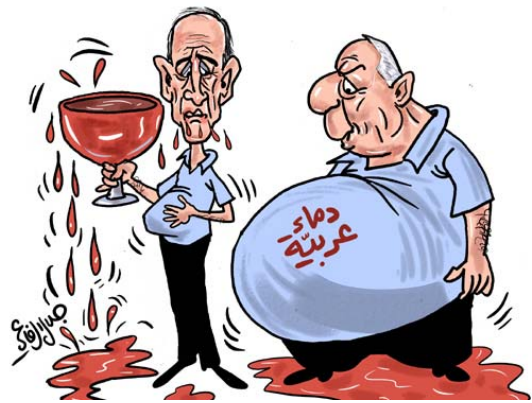
Ehud Olmert boit du sang avec l'ancien Premier ministre israélien Ariel Sharon; la légende sur le ventre de Sharon précise: "Sang arabe" (Jalal al-Rifa'i, Ad-Dustour, 8 juillet 2006)