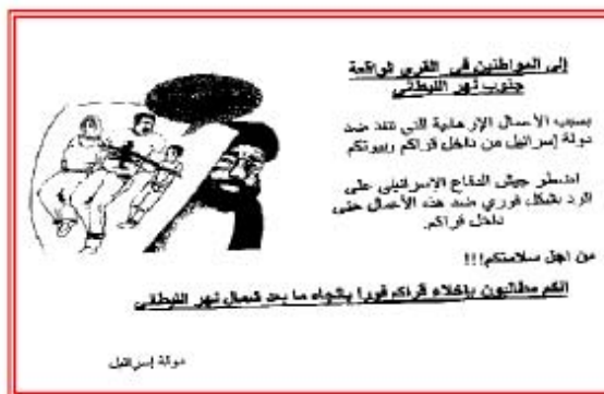
Слева: журналист телеканала "Аль-Арабия", держащий в руках листовку ЦАХАЛа (телеканал "Аль-Арабия", 26 июля). Справа: листовка, распространенная силами ЦАХАЛа, с обращением к жителям юга Ливана с просьбой покинуть дома.