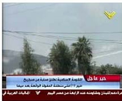
Запуск ракет дальнего радиуса действия по направлению Афулы (телевидение "Аль-Манар", 28 июля)