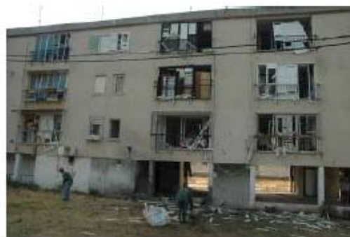
Разрушенные дома в Нагарии (справа) и в Кармиэле (слева). (Фотографии предоставлены полицией Израиля).