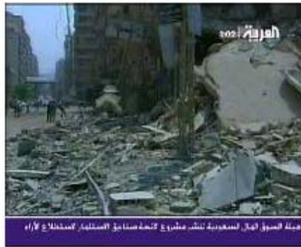
Здание в южной провинции Бейрута, атакованное ВВС Израиля (телеканал "Аль-Арабия", 27 июля)