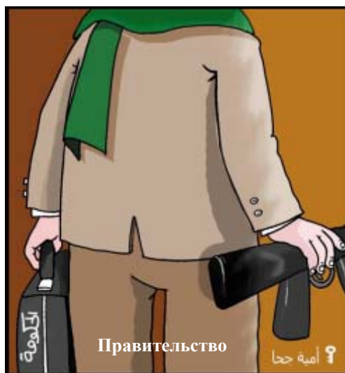
Новое правительство, в одной руке которого портфель, а в другой – оружие. Карикатура Омаи Джоха, известной своими прохамасовскими взглядами (источник: "Аль-Хайят Аль-Джадида", 1 февраля 2006 года)