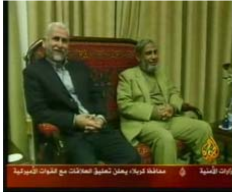
Два лидера ХАМАСа из сектора Газа, занимающие важные посты в правительстве: д-р Махмуд Аль-Захар, министр иностранных дел (справа) и Саид Сиам, министр внутренних дел и национальной безопасности (слева)