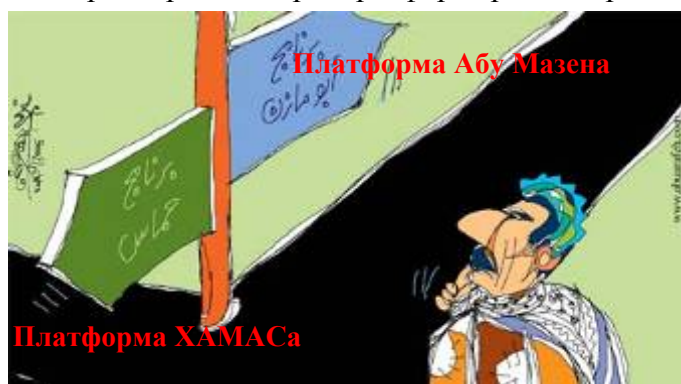
Две диаметрально-противоположные политические платформы в глазах палестинского карикатуриста (источник: "Аль-Кудс", 19 февраля 2006 года)