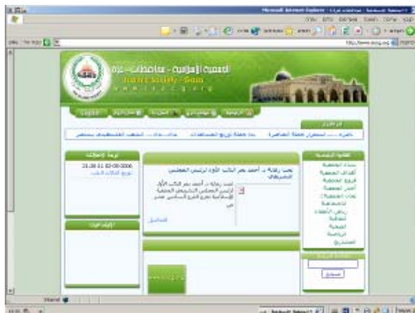
דף הבית של האתר

53. זהו האתר של ה"אגודה האסלאמית" (אלג'מעיה אלאסלאמיה") בעזה. ה"אגודה האסלאמית" משתייכת ל"חמא"ס", ומהווה חלק התשתית האזרחית הנרחבת של ה"חמא"ס" ברצועה. האגודה, שלה סניפים רבים ברצועה, עוסקת בפעילות חברתית ו"חינוכית", כולל הפעלת רשת גדולה של גני ילדים בהם מקבלים בני הגיל הרך חינוך לטרור ושנאה כלפי ישראל ברוח האידיאולוגיה האסלאמית הרדיקלית של ה"חמא"ס". האגודה הוכרזה בישראל כ"התאגדות בלתי מותרת" בשנת 2002. אתרי האינטרנט של האגודה משמשים לקבלת תרומות וסיוע כספי מקרנות ואגודות צדקה אזוריות ובינלאומיות.