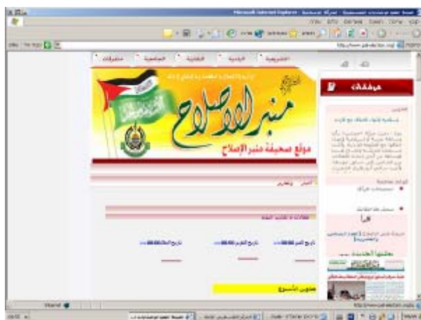
דף הבית של האתר

38. אתר חדש יחסית שקם לפני בחירות ל"מועצה המחוקקת" ב"רשות הפלסטינית" והתמסד מאז כאתר קבוע של ה"חמא"ס".