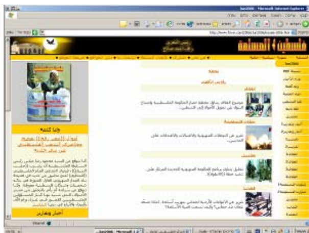
דף הבית של "פלסטין אלמסלמה"

40. מהדורה אינטרנטית של הירחון "פלסטין אלמסלמה" המשמש את ביטאונה העיקרי של ה"חמא"ס" מאז הקמתה. הוצאת הירחון להערכתנו, מאכזבת מדמשק, עותקיו הקשיחים מודפסים (או יוצאים לאור) בבירות ומופצים מבריטניה לגדה המערבית, לרצועת עזה, לעולם הערבי ואף לקהילות המוסלמיות באירופה, ארה"ב, קנדה ואוסטרליה 9