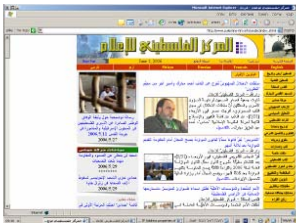
דף הבית של האתר בערבית

13. זהו אתר הראשי של תנועת ה"חמא"ס" בשפה הערבית. האתר משמש בידי התנועה כלי הסברתי מרכזי מול קהל היעד הפלסטיני וקהלים ערביים/מוסלמים נוספים ברחבי העולם.