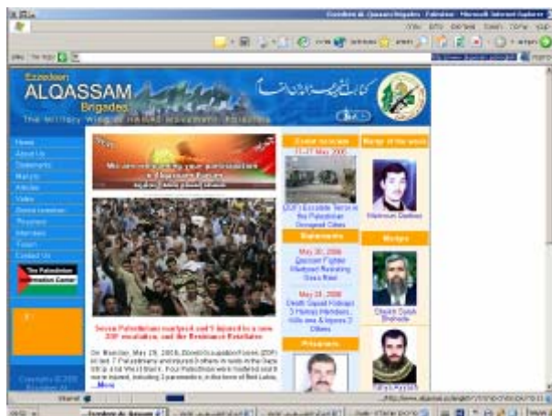
דף הבית של האתר בשפה האנגלית

31. לאתר של "גדודי עז אלדין אלקסאם", יש גם גירסה בשפה האנגלית. יצוין כי הוא אינו זהה בתוכנו לאתר בערבית אלא מהווה אתר נפרד בעל מסרים המותאמים יותר לקהל במדינות המערב.