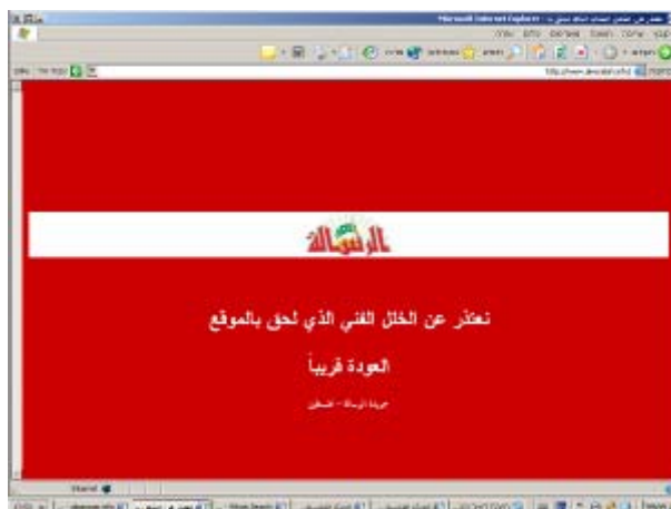
דף הבית של "אלרסאלה"