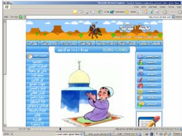
דף הבית של אתר עיתון הילדים "אלפאתח"

45. אתר עיתון הילדים של ה"חמא"ס" "אלפאתח". גיליון חדש של העיתון יוצא בכל חודש והוא מתפרסם במלואו באינטרנט. (העיתון מופיע כ"באנר" בדף הבית של האתר המרכזי בערבית). העיתון המיועד לילדים כולל שירים, סיפורים, ציורים וחומר דומה המפארים את עלילות הגבורה של ה"שהידים" בשפה ובאיורים המותאמים לבני הגיל הרך. האתר משמש לאינדוקטרינציה של ילדים ברוח האידיאולוגיה האסלאמית-רדיקלית של ה"חמא"ס". האתר מנציח את ה"שהידים", מטיף לטרור ואלימות נגד ישראל ומנסה להטמיע זאת בקרב הילדים.