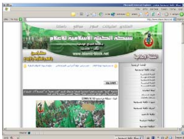
דף הבית של אתר "הגוש האסלאמי"

47. אתר המשמש את ה"גוש האסלאמי", תנועת הסטודנטים של ה"חמא"ס באוניברסיטת "אלנג'אח". האתר מטיף לאלימות ולטרור נגד ישראל. יוזכר כי סטודנטים מהאוניברסיטה מ"הגוש האסלאמי" נטלו חלק בולט במערכת הטרור של ה"חמא"ס נגד ישראל 10 .