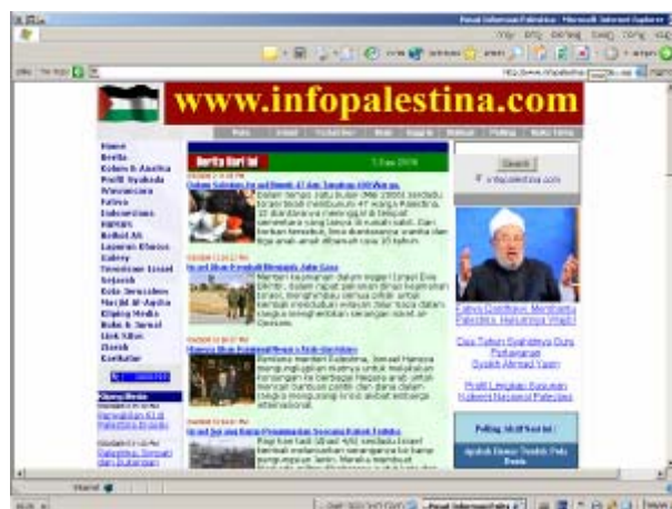
דף הבית של האתר באינדונזית

27. זהו אתר חדש יחסית בשפה האינדונזית, אשר עד כה אינו חלק מאתרי "המרכז הפלסטיני להסברה". זהו אתר נפרד העומד בפני עצמו אולם הוא דומה מאד בתכניו והגרפיקה שלו לאתרים בשאר השפות.