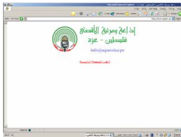
דף הבית של האתר

43. זהו האתר רשמי של "רדיו אלאקצא", שנסגר מספר פעמים בעקבות תכני הסתה שפרסם. האתר הפך עתה לאתר הקרוי www.aqsatv.ps . האתר נמצא בבנייה ועדיין לא פעיל.