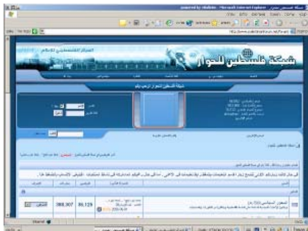
דף הבית של האתר