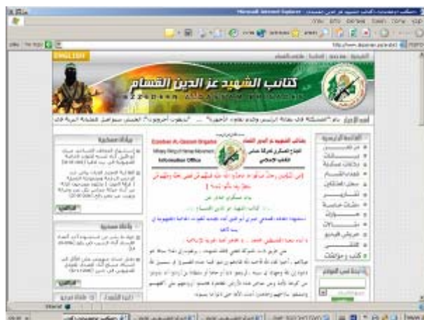
דף השער של האתר הרשמי של "גדודי עז אלדין אלקסאם"

29. זהו אתר הרשמי של "גדודי עז אלדין אלקסאם" הזרוע המבצעית-טרוריסטית של "חמאס". האתר מתמקד בדיווח על פעולות הטרור נגד ישראל ובהאדרת טרוריסטים שנהרגו בעת ביצוע פיגועים ("שהידים"). במסגרת זו האתר מדווח על פיגועים, מפרסם את צוואות המחבלים המתאבדים שהוקלטו טרם צאתם לפעולה ופועל להנצחתם של ה"שהידים". כמו כן מפרסם האתר ראיונות עם בכירי הזרוע המבצעית-טרוריסטית.