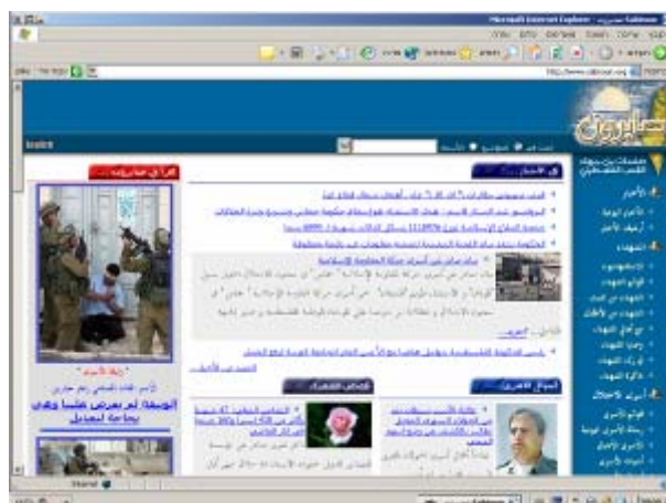
דף הבית של אתר "אלצאברון" 13

www.sabiroon.com/sabiroon.net/sabiroon.org