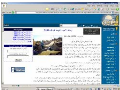
דף החדשות היומי באתר בו הופיעה הודעת אסירי ה"חמא"ס" המתייחסת ל"מסמך האסירים"

59. האתר נותן במה לאסירי ה"חמא"ס" הכלואים בבתי הכלא הישראליים ומפרסם במסגרת זו דף חדשות יומי. ב-6 יוני למשל, פרסמו בדף יומי זה אסירי ה"חמא"ס" הודעה רשמית לפיה הם מתנגדים לקיום משאל עם בנושא "מסמך האסירים".