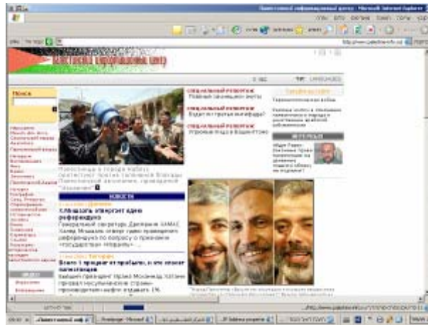
דף הבית של האתר ברוסית

23. אתר האינטרנט של ה"חמא"ס" בשפה הרוסית. אתר חדשתי ברובו אף כי נמצא בו פרק שלם המוקדש לקריקטורות ארסיות נגד ישראל וארה"ב.