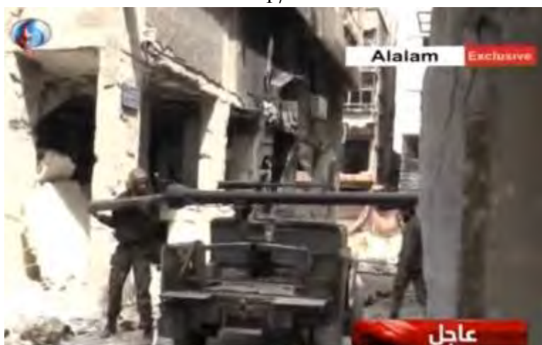
לחימה של פעילי החזית ג'בריל במחנה הפליטים אלירמוכ (אלעאלם, 15 באפריל 2015).