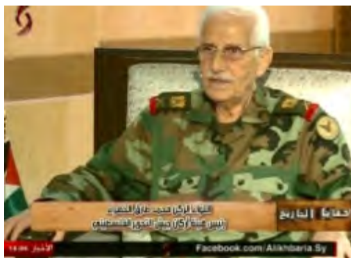
מפקד צש"פ לואא' (אלוף) מחמד טארק אלח'צ'ראא' (אלאח'באריה אלסוריה, 8 בספטמבר 2015).

חטיבת צש"פ, המופעלת ע"י צבא סוריה מונה כיום כ-6,000 בני אדם, מתוכם כ-3,000 חיילים נלחמים בפועל לצד הצבא הסורי. פעילות צש"פ במלחמת האזרחים התמקדה באזורי דמשק ובמידה פחותה בזירות לחימה אחרות: חמץ, חלב וסלמיה (כעשרים ק"מ דר' מז' לחמאה). כוחות מהחטיבה נטלו גם חלק באבטחת כביש חמץ-דמשק. צש"פ ספג לפחות 230 הרוגים מאז תחילת מלחמת האזרחים.