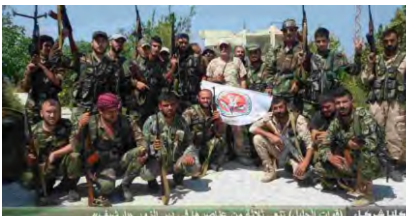
לוחמי כוחות הגליל (26, microsyria.com , בינואר 2017).

◀ במהלך מלחמת האזרחים רכשו כוחות הגליל ניסיון קרבי. תפקידם החשוב ביותר היה השתתפות בלחימה נגד הארגונים הג'האדיסטים בהרי אלקלמון, בקרבת הגבול הסורי-לבנוני. בחזית לחימה זאת מילא ארגון חזבאללה תפקיד מרכזי וסביר כי הפעלת כוחות הגליל התבצעה בתיאום איתו. ביוני 2016 דווח, כי כוחות הגליל החלו להילחם לצד הכוחות הסורים במרחב דיר אלזור. ב-23 בנובמבר 2017 דיווחו כוחות הגליל, כי הם נלחמים באזור שדה התעופה הצבאי אבו אלצ'הור, שמדרום לחלב, במסגרת המערכה על אדלב (שבה משתתפים כוחות פלסטינים, שהועברו ממרחב דיר אלזור).