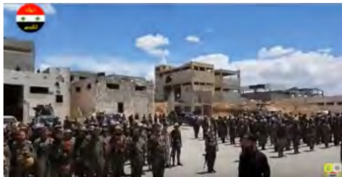
מסדר של חיילי חטיבת אלקדס (יוטיוב, 29 בנובמבר 2016).

חטיבת אלקדס הינה כוח צבא פלסטיני המופעל ע"י משטר אסד ככוח מסייע לצבא הסורי. החטיבה הוקמה באוקטובר 2013 והוא מונה כ-3,500 לוחמים. במהלך מלחמת האזרחים הופעלו לוחמי חטיבת אלקדס ע"י המשטר הסורי נגד ארגוני המורדים בזירות שונות, במשימות הגנתיות והתקפיות, ורכשו ניסיון קרבי, בעיקר בלחימה בשטח בנוי. נראה לנו, כי כוח זה הינו בעל הכשירות הצבאית הגבוהה ביותר מבין הכוחות והמליציות הפלסטיניות האחרות המופעלות ע"י המשטר הסורי. יתכן כי כוח זה נתמך כספית ולוגיסטית ע"י כוח קדס של משמרות המהפיכה האיראנים.