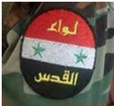
סמל חטיבת אלקדס על המדים הצבאיים של חיילי החטיבה. השם חטיבת אלקדס מופיע על רקע דגל סוריה (אלכות'ר, 9 בספטמבר 2017).

המתגוררים במחנה הפליטים אלנירב שבחלב. החטיבה מורכבת משלושה גדודים חמושים באמצעי לחימה, שהתקבלו מהצבא הסורי. תחילה הופעלו לוחמי החטיבה ע"י הצבא הסורי למשימות הגנה במחנות הפליטים בצפון סוריה ובהמשך הופעלו לביצוע משימות התקיפות נגד ארגוני המורדים ונגד המדינה האסלאמית בצפון סוריה ובמזרחה. חטיבת אלקדס שולבה, בין השאר, בקרבות בעמק הפרת בדיר אלזור, אלמיאדין ואלבוכמאל. ממזרח סוריה היא הועברה לאזור חלב והיא אמורה להשתתף במערכה לכיבוש מרחב אדלב. חטיבת אלקדס ספגה בקרבות הללו אבדות קשות המוערכות במאות הרוגים ומאות רבות של פצועים. אנשי החטיבה רכשו במהלך מלחמת האזרחים ניסיון קרבי עשיר והיא נתפסת כיחידה הפלסטינית הנאמנה ביותר למשטר הסורי.