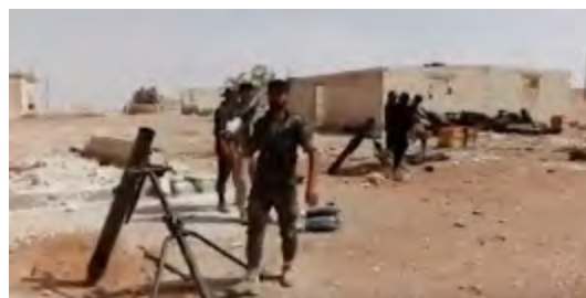
מימין: לוחמי צש"פ באזור סלמיה (כ-20 ק"מ דר' מז' לחמאה) יורים פצצות מרגמה לעבר המורדים (יוטיוב, 18 באוקטובר 2017). משמאל: ירי ארטילרי של צש"פ באזור סלמיה (סמא, 1 באוקטובר 2017).

◀ במהלך ינואר ופברואר 2018 השתתף צש"פ בלחימה, שעודנה מתנהלת באלע'וטה המזרחית (האזור שממזרח לדמשק), ולוחמיו ספגו אבידות. נראה כי גם במהלך בלחימה באלע'וטה המזרחית התעוררו בצש"פ ביטויי מחאה. משפחות המקורבות ללוחמי צש"פ דווחו כי המשטר הסורי מכריח אותם להילחם באלע'וטה המזרחית בניגוד לרצונם (מג'מועת אלעמל מן אג'ל פלסטיניי סוריה, 26 בפברואר 2018).