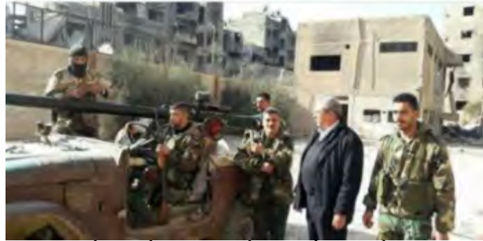
פעילי פתח-אלאנתפאצ'ה במחנה הפליטים אלירמוכ (דף הפייסבוק أسود فتح الانتفاضة, 13 בדצמבר 2017). מחנה הפליטים מוחזק ברובו ע"י דאעש והארגונים הנאמנים לסוריה שולטים רק על חלק קטן ממנו.