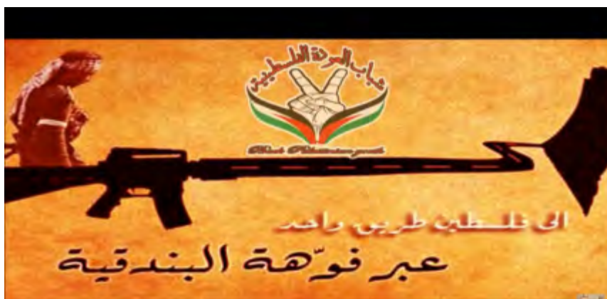
מתוך סרטון תעמולה של צעירי השיבה הפלסטינית: "אל פלסטין דרך אחת - דרך קנה הרובה" (ערוץ התנועה ביוטיוב, 1 בדצמבר 2012).