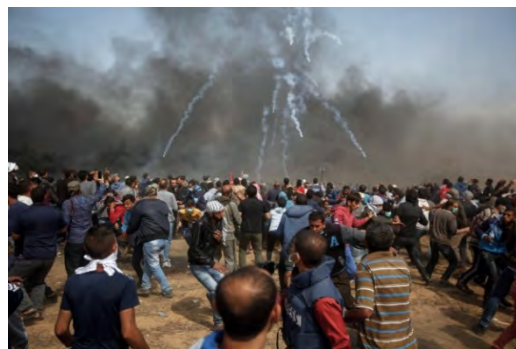
מפגינים פלסטינים סמוך לגדר הביטחון מזרחית לח'אן יונס (ופא, 27 באפריל 2018).