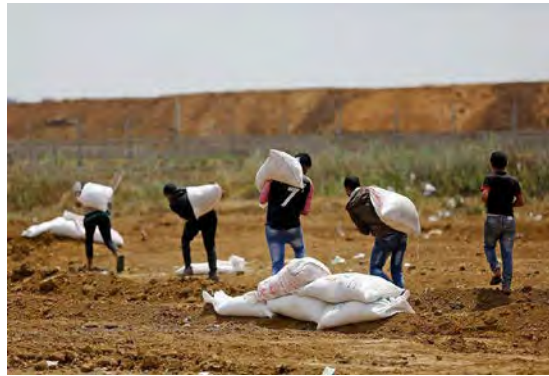
ילדים מכינים שקי עפר כמסתור והגנה עבור המפגינים (דף הפייסבוק שהאב, 27 באפריל 2018).