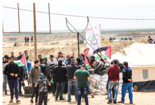
מימין: מפגינים ממקמים בליסטרה גדולה ליידיו אבנים סמוך לגדר הביטחון (דף הפייסבוק שהאב, 27 באפריל 2018). משמאל: פלסטינים מחבלים בגדר הביטחון מזרחית לג'באליא (חשבון הטוויטר PALINFO, 27 באפריל 2018).