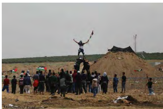
מימין: מפגינים מתקרבים לגדר המערכת ומתגרים בכוחות צה"ל. משמאל: עימותים בין מפגינים לבין כוחות צה"ל סמוך לגדר המערכת מזרחית לג'באליא (חשבון הטוויטר PALINFO, 27 באפריל 2018).