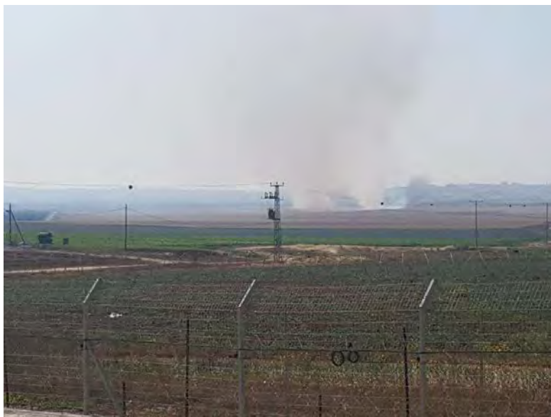
שריפה שפרצה באחד מיישובי עוטף עזה בעקבות שיגור עפיפון תבערה משטח הרצועה (חשבון הטוויטר PALINFO, 28 באפריל 2018).