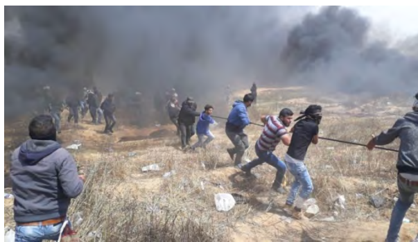
מפגינים, מזרחית לח'אן יונס, מושכים את גדר התיל ולאחר מכן חותכים אותה (PALINFO, 27 באפריל 2018).