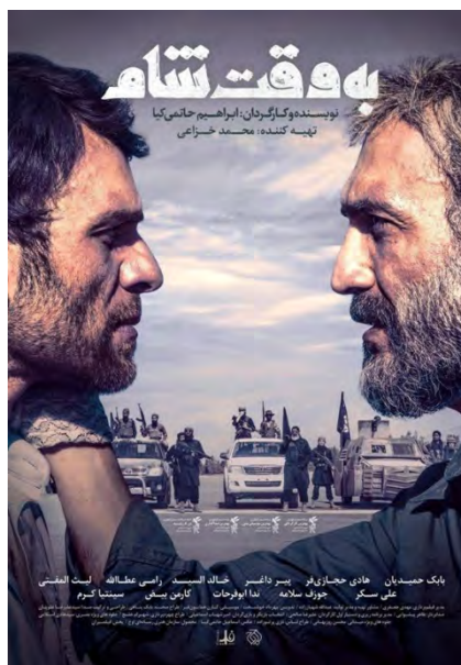
"זמן דמשק" (תסנים, 11 באפריל 2018)

◆ הסרט "זמן דמשק" מגולל את סיפורם של שני טייסים איראנים המעבירים סיוע הומניטרי לסוריה ופועלים להצלת תושבי העיר תדמור מידי דאעש באמצעות העברתם לדמשק. במהלך פעילותם הם נופלים בשבי דאעש. עלות הפקת הסרט נאמדת בקרוב לשני מיליון דולרים (icinema.ir, 7 באוגוסט 2017).