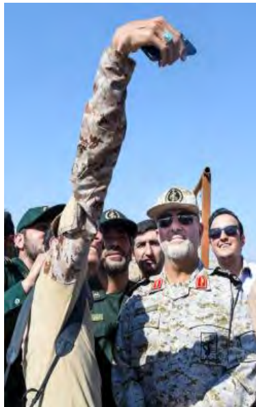
מפקד כוחות היבשה של משמרות המהפכה באתר הצילומים של סרט בהפקת אוג' (אתר הארגון, 25 ביולי 2017)

◀ התמיכה מצד משמרות המהפכה בארגון באה לידי ביטוי גם בסיוע לוגיסטי לפעילותו , למשל במתן היתרים לצילומי סרטים, שהארגון מבצע באתרים המשמשים את משמרות המהפכה. כך, למשל, פרסם אתר הארגון ביולי 2017 את תמונתו של מפקד כוחות היבשה של משמרות המהפכה, מחמד פאכפור (Mohammad Pakpour), במהלך צילומי סרט על מלחמת איראן-עיראק, שערך הארגון במפקדת חטיבה ממוכנת 20 של משמרות המהפכה.