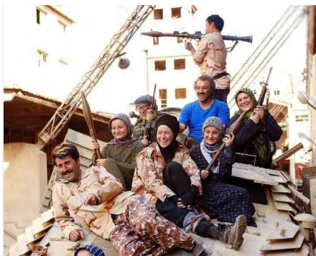
הסדרה "עיר בירה 5" (איסנ"א, 10 באפריל 2018)

◆ העונה החמישית בסדרת הטלוויזיה "עיר בירה 5" שודרה בטלוויזיה האיראנית במהלך חופשת ראש השנה האיראני (נורוז) באביב 2018. עונה זו גוללה את סיפורה של משפחה איראנית בצפון איראן, המוצאת עצמה במפגש מקרי עם טרוריסטים של דאעש בעקבות התרסקות בלון פורח באזור סוריה.