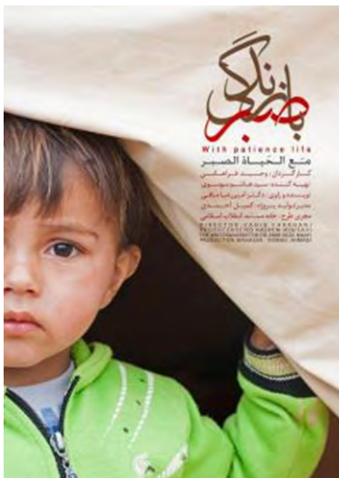
כרזת הסרט "עם סבלנות החיים" (אתר רשות השידור האיראנית, 28 במאי 2017)