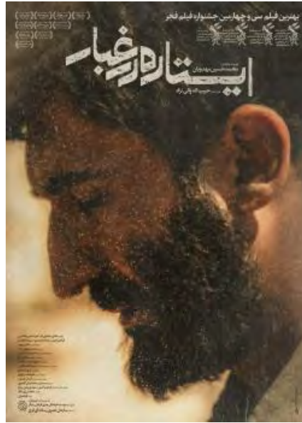
כרזת הסרט "עומד באבק" (אתר הארגון, 2 ביולי 2017)

◀ הסרטים והסדרות, שמפיק הארגון, משמשים גם לקידום ערכים דתיים אסלאמיים , כדוגמת סדרת טלוויזיה המתרחשת ביזד ומתעדת את החיים סביב המסגד בעיר. גם סרטים, שאינם נושאים לכאורה אופי אידיאולוגי, מגויסים להפצת תפיסות עולם המזוהות עם הזרם המהפכני האיראני . כך, למשל, הפיק ארגון אוג' סרט תיעודי על כוכב הכדורגל דייגו ארמנדו מראדונה, המתאר כיצד הצליח השחקן הארגנטינאי "להשפיל את המדינות האימפריאליסטיות". סרט תיעודי נוסף דן בחייו ובפועלו של לורנס איש ערב, ארכיאולוג וקצין בריטי, שפעל בארצות ערב בראשית המאה העשרים ובמהלך במלחמת העולם הראשונה. באמצעות הצגת דמותו של לורנס איש ערב, מבקש הסרט להבליט את השלכותיו השליליות של האימפריאליזם המערבי במזרח התיכון.