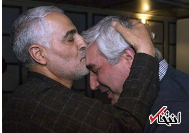
קאסם סלימאני, מפקד כוח קדס של משמרות המהפכה, נושק על מצחו של חאתמי-כיא במאי "זמן דמשק" (אנתח'אב, 9 בפברואר 2018)

◀ התמיכה מצד משמרות המהפכה בארגון באה לידי ביטוי גם בסיוע לוגיסטי לפעילותו , למשל במתן היתרים לצילומי סרטים, שהארגון מבצע באתרים המשמשים את משמרות המהפכה. כך, למשל, פרסם אתר הארגון ביולי 2017 את תמונתו של מפקד כוחות היבשה של משמרות המהפכה, מחמד פאכפור (Mohammad Pakpour), במהלך צילומי סרט על מלחמת איראן-עיראק, שערך הארגון במפקדת חטיבה ממוכנת 20 של משמרות המהפכה.