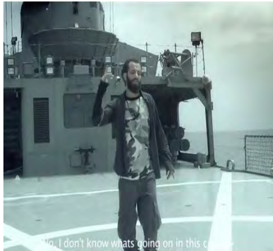
אמיר תתלו בקליפ "אנרגיה גרעינית" (15 ביולי 2015, https://www.youtube.com/watch?v=5HcPel7OFqo )