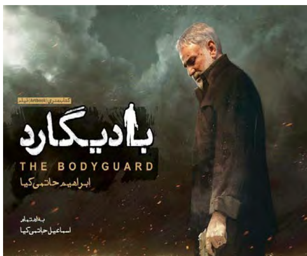
כרזת הסרט "שומר ראש" (תסנים, 26 באוקטובר 2016)

◀ רבים מסרטי התעודה ומהסדרות, שהופקו בחסות הארגון, עוסקים בסוגיות היסטוריות שונות מנקודת מבטה של הרפובליקה האסלאמית, ובמיוחד במהפכה האסלאמית ובמלחמת איראן-עיראק . כך, למשל, סדרה שהופקה בשנת 2017 מתארת את השתלשלות האירועים בעיר ח'רמשהר (Khoramshahr) שבדרום-מערב איראן החל מפרוץ מלחמת איראן-עיראק בספטמבר 1980, בהמשך כיבושה על-ידי עיראק באוקטובר 1980, ועד שחרורה על-ידי איראן במאי 1982. סרט נוסף בשם "מיצר אבו-ע'ריב" (באנגלית הופץ הסרט תחת השם: "The Lost Strait"), שהופק בשנת 2018, מבוסס על סיפור אמיתי ומגולל את סיפורו של גדוד איראני, שנלחם להגן על מיצר אסטרטגי מפני מתקפה עיראקית כבדה בשלהי מלחמת איראן-עיראק.