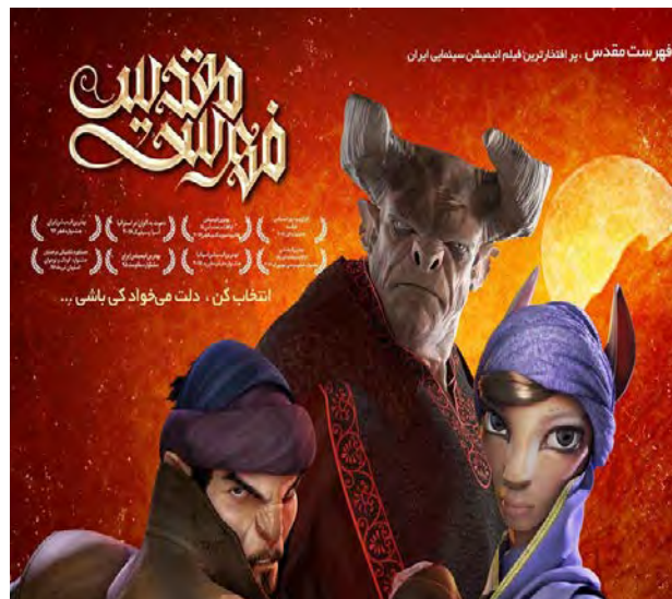
הסרט "הרשימה הקדושה" (תסנים, 31 בדצמבר 2017)

תפיסותיו האנטי-ציוניות והאנטישמיות של הארגון ניכרות גם בסרטים המופקים על-ידו. בשנת 2017 הוקרן לראשונה סרט אנימציה בהפקת הארגון בשם "הרשימה הקדושה" (באנגלית הופץ הסרטון תחת השם: Holy Cast). הסרט, שזכה בפרס סרט האנימציה הטוב ביותר בפסטיבל פג'ר ה-34 בשנת 2016, מתאר את ה"טבח", שבוצע על-פי מקורות מוסלמים על-ידי יהודים בנג'ראן שבתימן של ימינו בתושבי העיר הנוצרים בתקופה הטרומ-אסלאמית. בדיווח אודות הסרט, שהתפרסם באתר הרשמי של אוג', כונה ה"טבח" "השואה הראשונה", שבוצעה על-ידי "אבות הפושעים בני-ציון נגד הנוצרים" (אתר אוג', 3 בפברואר 2016).