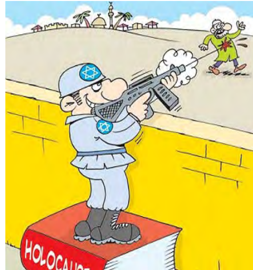
קריקטורות שהוצגו במסגרת התחרות השנייה של קריקטורות בנושאי שואה (2015), שארגון אוג' השתתף במימונה (תסנים, 19 בינואר, 2015; דפאע פרס, 19 בינואר, 2015)

תפיסותיו האנטי-ציוניות והאנטישמיות של הארגון ניכרות גם בסרטים המופקים על-ידו. בשנת 2017 הוקרן לראשונה סרט אנימציה בהפקת הארגון בשם "הרשימה הקדושה" (באנגלית הופץ הסרטון תחת השם: Holy Cast). הסרט, שזכה בפרס סרט האנימציה הטוב ביותר בפסטיבל פג'ר ה-34 בשנת 2016, מתאר את ה"טבח", שבוצע על-פי מקורות מוסלמים על-ידי יהודים בנג'ראן שבתימן של ימינו בתושבי העיר הנוצרים בתקופה הטרומ-אסלאמית. בדיווח אודות הסרט, שהתפרסם באתר הרשמי של אוג', כונה ה"טבח" "השואה הראשונה", שבוצעה על-ידי "אבות הפושעים בני-ציון נגד הנוצרים" (אתר אוג', 3 בפברואר 2016).