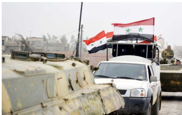
Подкрепления сил сирийской армии движутся по сельской местности в районе г. Идлиб