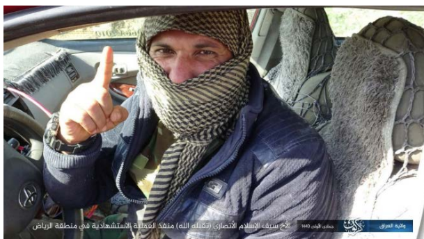
террорист-смертник организации, известный под прозвищем Сайеф Аль Ислам Аль Ансари, отправляется на совершение самоубийственного теракта (округ Ирак – Киркук организации ИГИЛ, 27 января 2019 г.).