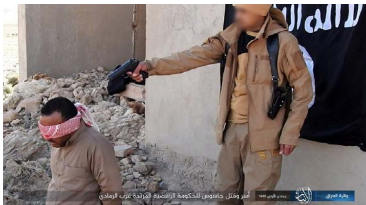
Казнь агента иракского правительства, который был захвачен в плен боевиками организации ИГИЛ, к западу от г. Аль Рамади (округ Ирак – Аль Анвар организации ИГИЛ, 28 января 2019 г.)