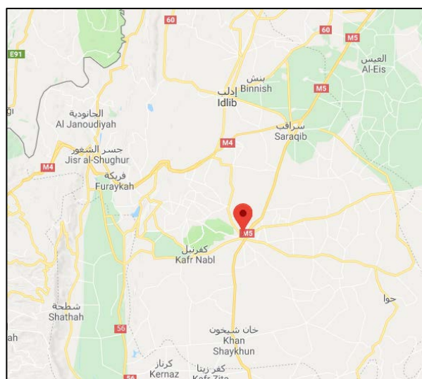
Г. Меарат Аль Нааман (Google Maps)

► 28-го января 2019 г., во второй половине дня, отряд боевиков из группировки "Штаб по освобождению Аль Шаам" вошел в г. Меарат Аль Нааман, который находится приблизительно в 31 км к югу от г. Идлиб, и захватил командный пункт организации "Филек Аль Шаам" (которая действует под покровительством Турции) 1 . Ведутся переговоры между лидерами городской общины и представителями группировки "Штаб по освобождению Аль Шаам", с целью прийти к соглашению на тему способа управления городом (сирийский наблюдательный центр по защите прав человека, 29 января 2019 г.). Г. Меарат Аль Нааман имеет большое стратегическое значение, так как он расположен у центральной трассы, ведущей из г. Халеб в г. Хама и используется в качестве важного транспортного узла.