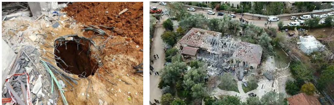
מימין : צילום רחפן של הבית שנפגע. משמאל: החור שנפער באדמה בעקבות פגיעת הרקטה.