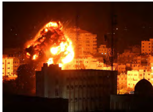
מימין: תקיפת לשכתו של אסמאעיל הניה (דף הפייסבוק QUDSN, 25 במרץ 2019). משמאל: לשכתו של הניה בעזה לאחר התקיפה (דף הפייסבוק QUDSN, 26 במרץ 2019).