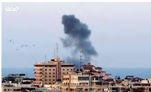
תקיפת צה"ל בעזה (דף הפייסבוק QUDSN, 26 במרץ 2019).