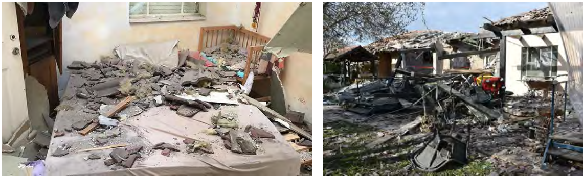
הרס רב שנגרם לבית במושב משמרת בשרון בעקבות ירי הרקטה (מימין: משטרת ישראל, משמאל: כבאות הצלה, 25 במרץ 2019).

◀ ב-25-26 במרץ 2019 התחולל סבב הסלמה נוסף ברצועת עזה. הסבב החל לאחר שב-25 במרץ בשעות הבוקר המוקדמות שוגרה רקטה מרצועת עזה לעבר ישראל. אזעקה הופעלה באזור השרון ובמועצה המקומית עמק חפר. הרקטה פגעה בבית במושב משמרת שבשרון . שבעה בני אדם נפצעו, ביניהם שני ילדים. נזק רב נגרם לבית. הייתה זו אזעקה ראשונה באזור השרון מאז מבצע "צוק איתן" (יולי אוגוסט 2014). הרקטה שוגרה ככל הנראה מרפיח, מרחק של כ-120 ק"מ מהמקום בו נפלה.