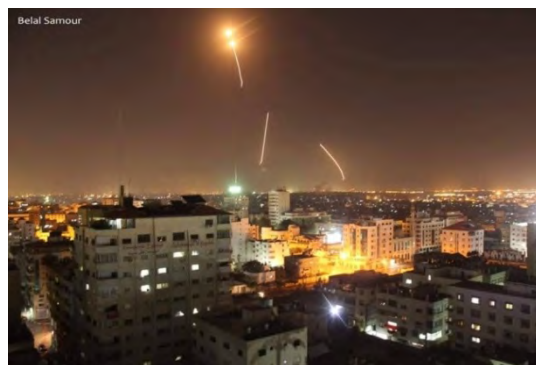
תיעוד שיגורי רקטות מהרצועה לעבר ישראל (דף הפייסבוק QUDSN, 25 במרץ 2019).