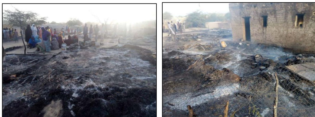
ההריסות במקום פיגוע ההתאבדות (עמוד הטוויטר של @MENASTREAM, 27 במרץ 2019).