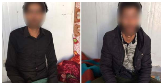
שני פעילי דאעש, שנעצרו על-ידי הגיוס העממי במזרח מחוז אלאנבאר (al-hashed.net, 27 במרץ 2019).

◆ מחוז אלאנבאר: הגיוס העממי עצר שני פעילי דאעש במזרח מחוז אלאנבאר. העצורים, שהודו בהשתייכותם לדאעש, ציינו כי הממונה עליהם היה אזרח זר (al-hashed.net, 27 במרץ 2019).