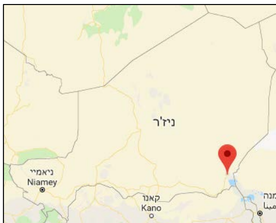
העיר נגויגמי (N'guigmi), שבדרום מזרח ניג'ר (Google Maps).

לעבר אזרחים. בפיגוע נהרגו לפחות עשרה בני אדם ושבעה או שמונה נפצעו. לא פורסמה הודעת קבלת אחריות (אלג'זירה, 27 במרץ 2019). סביר שאת הפיגוע ביצע מחוז מערב אפריקה של דאעש.