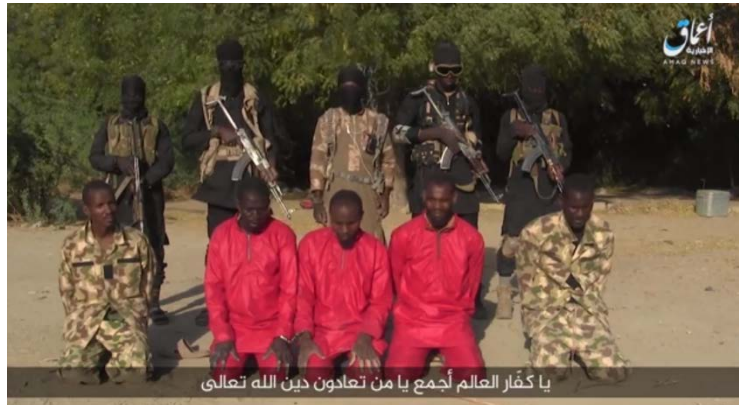
חיילי צבא ניגריה טרם הוצאתם להורג על-ידי פעילי דאעש (טלגרם, 1 באפריל 2019).

סוכנות אעמאק של דאעש פרסמה סרטון המתעד הוצאה להורג של חיילים ניגרים. בסרטון נראים חמישה פעילי דאעש רעולי פנים מוציאים להורג חמישה חיילי צבא ניגריה. ההוצאה להורג בוצעה במדינת בורנו, שבצפון מזרח ניגריה. הדובר בסרטון פונה ל"כופרים" בעולם ואומר כי הם לא יחדלו מהלחימה עד שדתו של אללה תתפשט לכל מקום (טלגרם, 1 באפריל 2019).