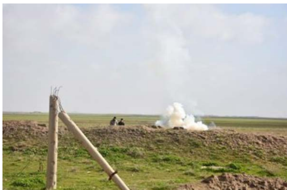
פיצוץ מבוקר של מטעני חבלה, שאותרו על-ידי צוות הנדסה של הגיוס העממי במחוז אלאנבאר (al-hashed.net, 30 במרץ 2019).

◆ מחוז אלאנבאר: צוות הנדסה של הגיוס העממי איתר ונטרל מספר מטעני חבלה באזור עכאשאת, כ-70 ק"מ מצפון לאלרטבה (al-hashed.net, 30 במרץ 2019).