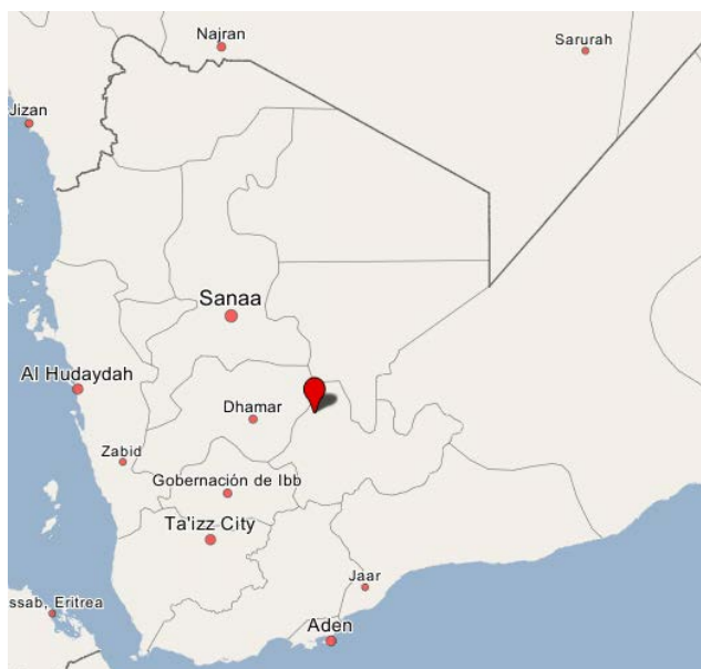
מקום ההתנגשות בין דאעש לאלקאעדה בצפון מערב אזור אלביצ'אא' (Wikimapia).

◀ לאחרונה ניכרת עלייה בתדירות ובעצימות של העימותים בין פעילי דאעש לפעילי אלקאעדה, באזור אלביצ'אא'. ארגון אלקאעדה הודיע כי פעיליו השתלטו על אזור אלחמיצ'ה, שבאלביצ'אא', (95 ק"מ מדרום מזרח לצנעא) והרגו חוליה של פעילי דאעש (טלגרם, 1 באפריל 2019). מנגד, סוכנות אעמאק של דאעש הודיעה, כי פעילי הארגון הרגו ופצעו לפחות עשרה פעילי אלקאעדה בעימותים בצפון מערב אלביצ'אא' (טלגרם, 1 באפריל 2019).