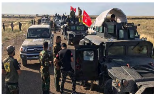
כוחות ממונעים של "הגיוס העממי" הפועלים במסגרת המבצע הצבאי נגד פעילי דאעש במדבר צלאח אלדין (al-hashed.net, 5 במאי 2019).