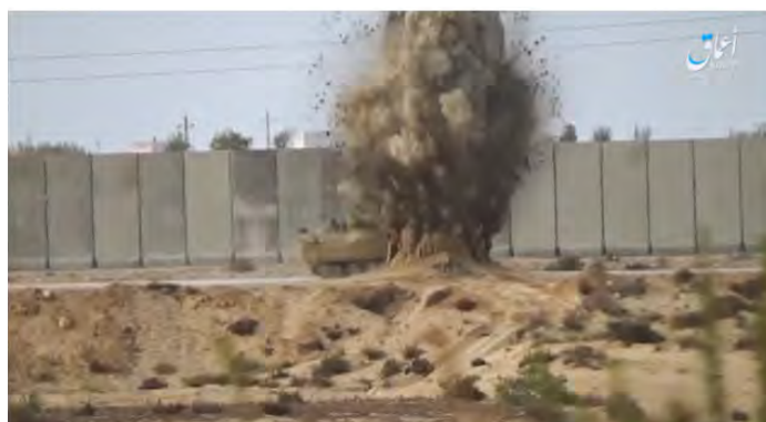
הפעלת מטען החבלה נגד נגמ"ש של צבא מצרים על-ידי דאעש (1 במאי 2019, www.khfalh.ga).

◀ "מקורות מקומיים בצפון סיני" מסרו, כי חמישה חיילים מצרים נהרגו ותשעה נפצעו בהתקפות שביצעו ככל הנראה פעילי מחוז סיני של דאעש בצפון סיני. כמה מהאירועים הללו: חילופי-אש בין "פעילי טרור" לצבא המצרי מערבית לעיר רפיח, שנמשכו יותר משעה; ירי צלפים שכתוצאה ממנו נהרג חייל מצרי על הכביש הבינלאומי ממערב; הפעלת מטען סמוך לאלעריש. שני חיילים נהרגו ושלושה נפצעו (חשבון הפייסבוק @ShahidSinai, 3 במאי 2019).