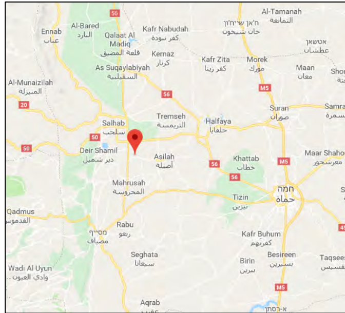
מיקומו של בסיס חיל האוויר הסורי באזור ג'ב רמלה.