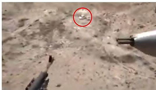
מימין: ירי ממסוק לעבר כלי רכב של דאעש במהלך מבצע "אריות אלג'זירה". משמאל: מסוק של צבא עיראק מנחית כוחות קרקעיים (ערוץ היוטיוב NAS, אתר חדשות עיראקי, 5 במאי 2019).