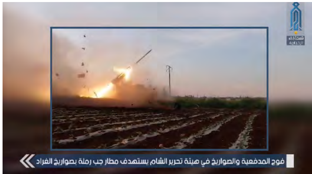
فوج المدفعية والصواريخ في هيئة تحرير الشام يستهدف مطار جب رملة بصواريخ الفراد