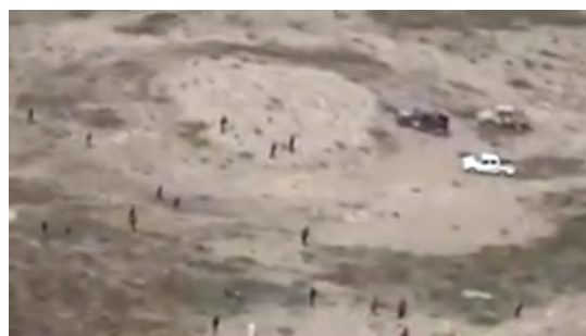
מימין: חיילי צבא עיראק ואנשי הגיוס השבטי במהלך מבצע "אריות אלג'זירה" בקרבת כלי רכב, ששימשו את פעילי דאעש. משמאל: כוחות עיראקים נעים על ציר עפר.