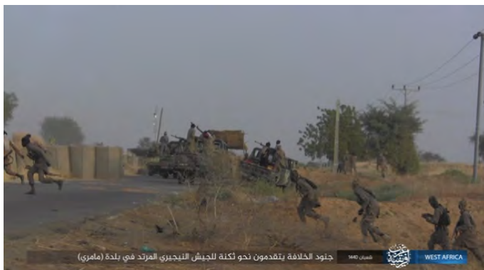
جنود الخلافة يتقدمون نحو كتلة للجيش النيجيري المرتد في بلدة (مامري) WEST AFRICA

מימין: הסתערות של פעילי דאעש נגד המוצב של צבא ניגריה (www.khfal.h.ga, 3 במאי 2019). משמאל: המוצב מועלה באש (www.khfal.h.ga, 3 במאי 2019).