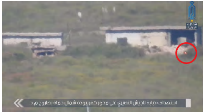
טיל נ"ט, ששוגר לעבר טנק של צבא סוריה (אבאא', 4 במאי 2019).

◆ ירי רקטות לעבר מחנה של צבא סוריה: המטה לשחרור אלשאם הודיע כי שיגר רקטות לעבר מחנה צבא סוריה, הנמצא 37 ק"מ מצפון מערב לחמאה. על פי ההודעה נהרגו 18 לוחמים של מיליצית "הנמר" (של הקולונל סהיל אלחסן) ונפצעו 23 (אבאא', 5 במאי 2019).