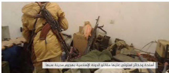
أسلحة و ذخائر استولى عليها مقاتلو الدولة الإسلامية بهجوم مدينة سبها

נשק ותחמושת שנפלו לידי דאעש בהתקפה נגד המפקדה הצבאית של חפטר באזור סבהא (מימין: טלגרם, 4 במאי 2019) (משמאל: www.khfal.h.ga, 2 במאי 2019).