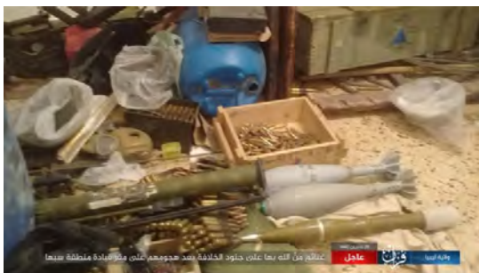
مخلفات من قتلها على جنود الخلافة بعد هجومهم على مقر قيادة منطقة سبها

◀ סוכנות אעמאק של דאעש הודיעה כי 16 לוחמים מצבא חפטר נהרגו ונפצעו בהתקפה שביצעו פעילי דאעש נגד מטה של המפקדה הצבאית של חפטר באזור סבהא. התוקפים שחררו את כל האסירים שהיו כלואים שם, לקחו שלל ועזבו את המקום ללא נפגעים (טלגרם, 4 במאי 2019). מקורות מקומיים בלוב אישרו את הדיווח וציינו כי בין שמונה לתשעה לוחמים מצבא חפטר נהרגו בהתקפה (אלג'זירה, 4 במאי 2019).