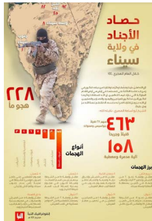
Infographie résumant l'activité de l'Etat islamique dans la péninsule du Sinäï au cours de la dernière année (Al-Naba', publié dans Akhbar al-Muslimeen, 12 septembre 2019)

le 30 août 2019. Selon l'infographie, la province du Sinäï a mené 228 attaques, au cours desquelles 463 personnes ont été tuées et blessées. Au total, 27 personnes ont été désignées comme "agents et "combattants de la milice locale" (tribus bédouines de la péninsule du Sinäï qui collaborent avec le gouvernement égyptien). Selon l'infographie, les types d'attaques perpétrées sont les suivants : explosions d'engins piégés (157); tirs de tireur d'élite (30); échanges de tirs (21); embuscades (7); raids (6); attentats suicide (4); et assassinats (3) (Al-Naba', publié dans Akhbar al-Muslimeen, 12 septembre 2019).