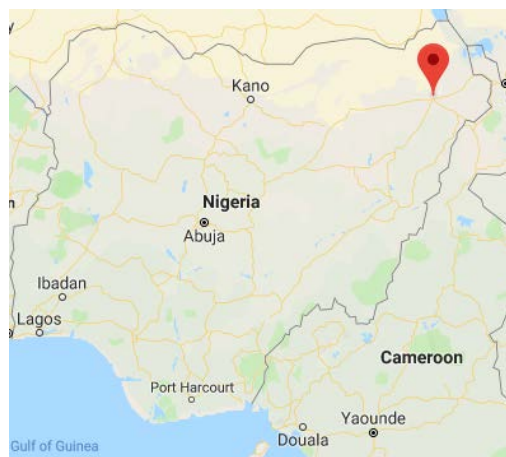
La ville de Maiduguri, dans le Nord-Est du Nigéria