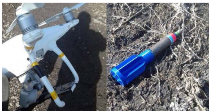
Un drone armé abattu par la mobilisation populaire au Sud-Est de Baqubah (al-hashed.net, 11 septembre 2019)