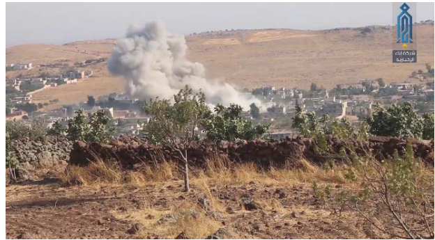
Droite : Les forces aériennes syriennes attaquent le village de Safuhan, au Sud d'Idlib. Gauche : Un bâtiment détruit lors des frappes aériennes (Ibaa, 12 septembre 2019)

► Parallèlement, des échanges de tirs d'artillerie ont eu lieu, principalement dans le Sud et l'Est de la région d'Idlib. Le 14 septembre 2019 , l'armée syrienne et les milices la soutenant auraient tiré environ 240 roquettes sur des cibles dans la région d'Idlib. Les 15 et 16 septembre 2019 , l'artillerie a encore tiré sur des cibles d'organisations rebelles dans la région d'Idlib (Observatoire syrien des droits de l'homme, 14 et 16 septembre 2019). Le 17 septembre 2019 , le Front de libération nationale (soutenu par la Turquie) aurait tiré sur des positions de l'armée syrienne au Sud d'Idlib et dans la partie occidentale de la région d'Idlib. En réponse, l'armée syrienne a tiré de l'artillerie sur des positions du Siège de Libération d'Al-Sham et d'autres organisations rebelles (Al-Watan, affilié au régime syrien, 18 septembre 2019).