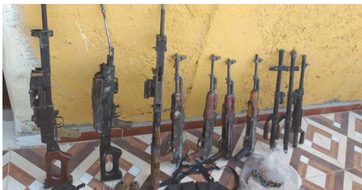
Armes découvertes en possession de quatre membres de l'Etat islamique au Sud-Est d'Al-Mayadeen (SDF Press, 14 septembre 2019)

► Dans le cadre de leurs activités antiterroristes contre les réseaux de l'Etat islamique, les forces des FDS ont capturé quatre membres de l'Etat islamique à environ 30 km au Sud-Est d'Al-Mayadeen. Ils ont également trouvé des armes en leur possession (SDF Press, 14 septembre 2019).