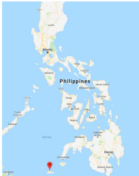
L'île de Sulu-Jolo au Sud des Philippines