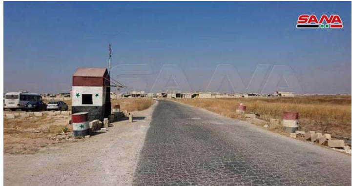
Droite : Le "passage humanitaire" d'Abu Zuhur (SANA, 14 septembre 2019). Gauche : Zones où se trouvent les deux "passages humanitaires" (Google Maps)