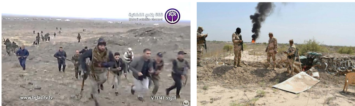
Droite : Les forces de sécurité irakiennes près d'une cachette de l'Etat islamique dans la province de Salah al-Din (Agence de presse irakienne, 9 décembre 2019). Gauche : Des combattants de la mobilisation populaire effectuent des recherches dans la région montagneuse de la province de Diyala (Chaîne de télévision irakienne Baladi, 10 décembre 2019)

► Les forces de sécurité irakiennes (en collaboration avec la Mobilisation populaire) poursuivent leur opération de sécurité à grande échelle pour débarrasser le Nord et l'Ouest de l'Irak des membres de l'Etat islamique (opération Will to Victory). L'activité de cette semaine s'est concentrée sur les provinces de Salah al-Din, Diyala et Kirkuk. Au total, 21 individus recherchés ont été capturés pendant l'opération. Selon les médias irakiens, 18 tunnels et 20 cachettes de l'Etat islamique ont été détruits et des dizaines d'engins piégés, des ceintures explosives, des munitions et du matériel militaire ont été saisis (Iraqi News Agency, 9 décembre 2019; al-hashed.net, 8 décembre, 2019; Baladi TV Iraqi channel, 10 décembre 2019).