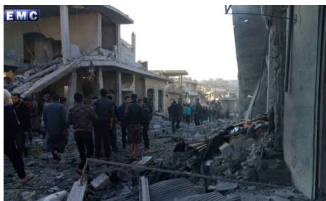
Bâtiments touchés par les frappes aériennes au Sud d'Idlib (Edlib Media Center - EMC, 7 décembre 2019)

◆ Le 7 décembre 2019 , des avions de chasse russes ont effectué une frappe aérienne autour du village d'Al-Sheikh Bahr, à 22 km au Nord-Ouest d'Idlib (Edlib Media Center - EMC, 7 décembre 2019).