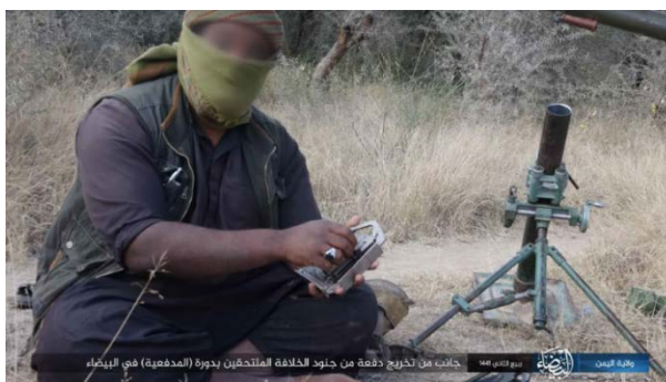
Droite : Membre de l'Etat islamique (probablement un instructeur de cours). Gauche : Stagiaires lors d'une session de cours (Telegram, 9 décembre 2019)