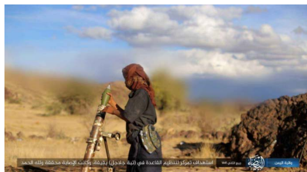
Tir d'obus de mortier sur des membres d'Al-Qaïda dans la région de Qifah (Telegram, 9 décembre 2019)