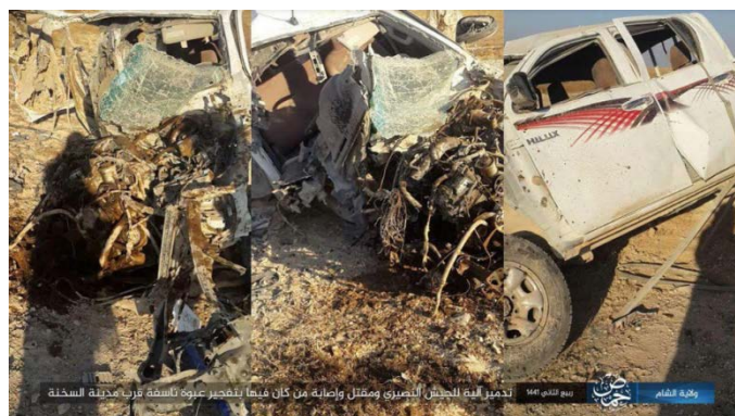
Un véhicule de l'armée syrienne détruit à la suite de l'explosion d'un engin piégé par l'Etat islamique près d'Al-Sukhnah (Telegram, 9 décembre 2019)