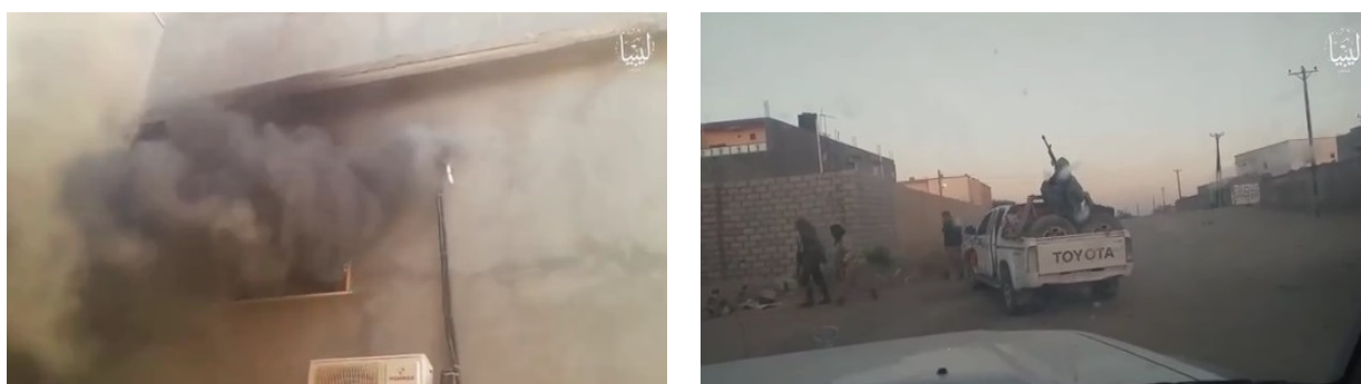
Droite : Introduction par effraction dans une maison à Ghadwa. Gauche : Incendie de la maison