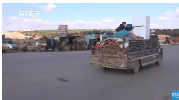
Résidents qui ont fui la zone rurale au Sud et à l'Est d'Idlib en direction de la frontière entre la Syrie et la Turquie (Khotwa, 3 décembre 2019)