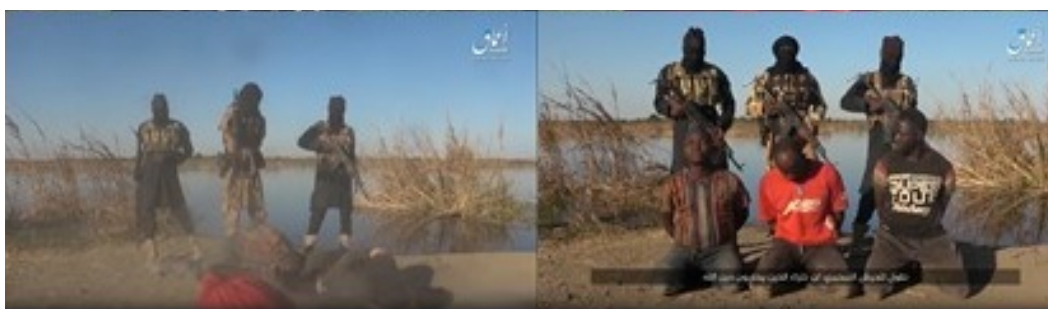
Photos de la vidéo documentant l'exécution (Telegram, 8 décembre 2019)

◆ Le 8 décembre 2019 , l'agence de presse Amaq de l'Etat islamique a publié une vidéo documentant l'exécution de trois policiers nigériens dans l'État de Borno, dans le Nord-Est du Nigéria (Telegram, 8 décembre 2019).