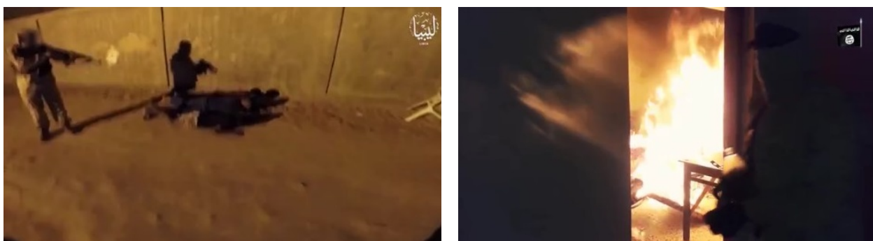
Droite : Des membres de l'Etat islamique ont incendié le bâtiment de la Garde locale de Fuqaha (Akhbar al-Muslimeen, 4 décembre 2019). Gauche : Des membres de l'Etat islamique exécutant des membres des forces de sécurité qui sont arrivés sur les lieux (Akhbar al-Muslimeen, 4 décembre 2019)