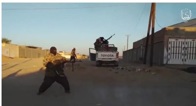
Droite : Tirs, apparemment contre les forces de sécurité locales de la ville de Ghadwa (Akhbar al-Muslimeen, 4 décembre 2019). Gauche : Des membres de l'Etat islamique quittant la ville de Ghadwa et conduisant dans le désert (Akhbar al-Muslimeen, 4 décembre 2019)

La Province de Libye de l'Etat islamique a subi un coup dur avec la chute de la région de Syrte en Décembre 2016 . Cependant, l'organisation n'a pas été éradiquée de la Libye et son activité a été délocalisée dans le Centre et le Sud du pays . L'année dernière, des rapports ont fait état de tentatives de réorganisation de la province de Libye, compte tenu de la situation précaire du pays en matière de sécurité, en particulier dans le Sud. L'activité de la province de Libye est apparemment concentrée dans la région de Sabha et dans les zones montagneuses du centre de la Libye. Selon une estimation de 2018, la province libyenne de l'Etat islamique compte 3000 à 4000 membres (undocs.org, 4 mai 2019; Asharq Al-Awsat, 17 octobre 2019; The Washington Post, 24 novembre 2019).