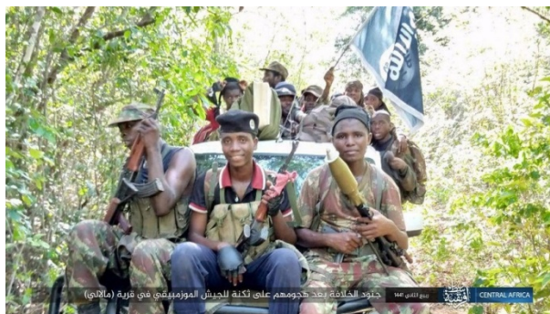
Droite : Membres de l'Etat islamique après avoir attaqué le camp de l'armée mozambicaine. Gauche : Armes et munitions de l'armée mozambicaine saisies (Telegram, 9 décembre 2019)