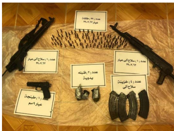
Armes et munitions trouvées en possession de terroristes de l'Etat islamique tués par la police égyptienne dans la région de Jalbana dans le Nord de la péninsule du Sinaï