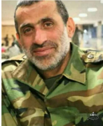
מהראן עזיזאני, שהוצא להורג בסוריה (פארס, 18 במרץ 2020)