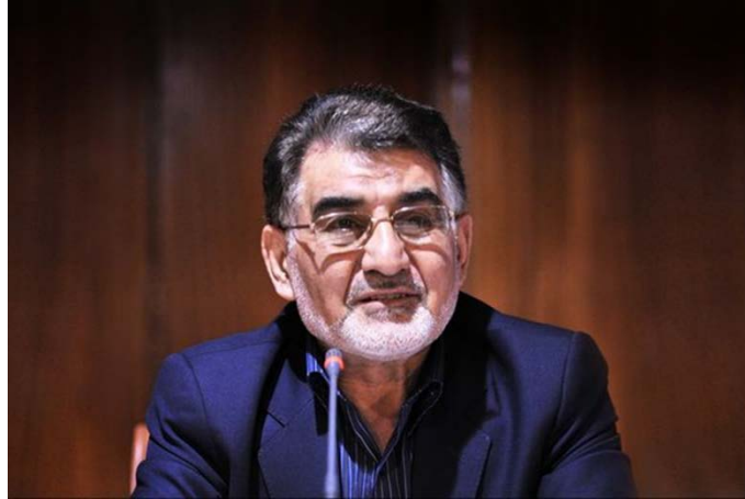
ראש לשכת המסחר המשותפת לאיראן ולעיראק (אקתצאד אונליין, 15 במרץ 2020)