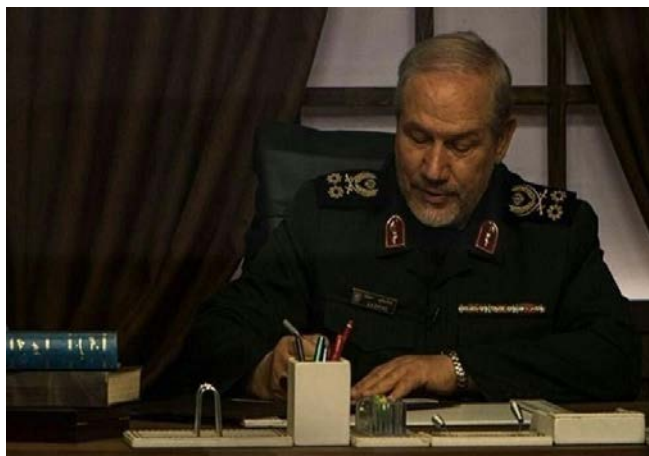
יועצו הביטחוני הבכיר של מנהיג איראן, יחיא רחים צפוי תסנים, 1 באפריל 2020.

◀ יועצו הביטחוני הבכיר של מנהיג איראן ומפקד משמרות המהפכה לשעבר, סיד יחיא רחים צפוי (Seyyed Yahya Rahim Safavi), התייחס, אף הוא, להתפתחויות בעיראק. במאמר פרשנות, שפרסמו סוכנויות הידיעות "תסנים" ו"פארס" המזוהות עם משמרות המהפכה (1 באפריל 2020) הזהיר צפוי, כי אם תתעלם ארצות-הברית מדרישת הפרלמנט העיראקי להוציא את כוחותיה מעיראק, יהיה עליה לשאת באחריות להשלכות נוכחותה הבלתי-חוקית בעיראק. הוא ציין, כי המצב הכלכלי והפוליטי בארצות-הברית בצל התפרצות הקורונה והבחירות המתקרבות לנשיאות מקשות על יכולתה לנהל עימות צבאי באזור. צפוי קרא לאנשי הממשל והצבא האמריקאים לשקול את השלכותיה של כל פעולה עליה יחליטו והזהיר, כי העם העיראקי, הצעירים העיראקים וקבוצות ההתנגדות מוכנים לפעול נגד כל פעולה צבאית אמריקאית.