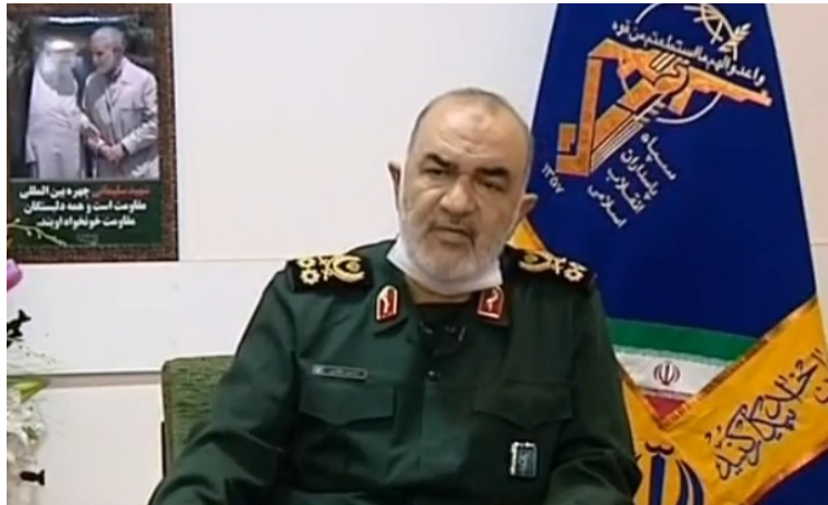
מפקד משמרות המהפכה, חסין סלאמי (דפאע פרס, 28 במרץ 2020).

אמר סלאמי, כי האפשרות היחידה שיש בידי האמריקאים היא לעזוב את האזור וכי נוכחותם באזור מזיקה גם לעצמם וגם לעמי האזור. לדבריו, האמריקאים חשבו, שחיסול קאסם סלימאני ואבו-מהדי אלמהנדס יכבה את "לפיד ההתנגדות" ושהם יוכלו לשנות את התנאים הפוליטיים והביטחוניים באזור, אך למעשה החיסול הביא להגברת הלחץ לנסיגת האמריקאים מעיראק. סלאמי קרא לשלטונות האמריקאים לדאוג לחייהם של אזרחי ארצם המתים מהקורונה בניו-יורק ובמדינות אחרות של ארצות-הברית במקום לחשוב על "תסריטים הוליוודים" והרג אזרחים בעיראק (דפאע פרס, 28 במרץ 2020).