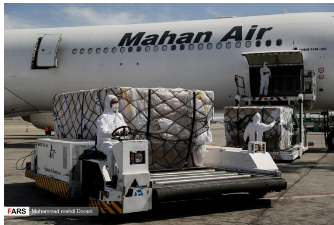
העברת ציוד רפואי על-ידי חברת התעופה "מאהאן אייר" ( פארס, 20 במרץ 2020 ).

◀ בעקבות התפרצות הקורונה, נמשך השימוש במטוסים איראנים, ששימשו בעבר להעברת אמצעי לחימה מאיראן לסוריה, לטובת העברת ציוד רפואי מסין לאיראן. מטוסים של חברת פארס קשם אייר (Fars Qeshm Air), ששימשו בעבר לביצוע טיסות מטען מאיראן לסוריה, העבירו במחצית השנייה של חודש מרץ ציוד רפואי משנג'ן שבסין לאיראן (akhbaralaan.net, 26 במרץ). עם זאת, נמשכות טיסות איראניות גם בציר טהראן-דמשק, ככל הנראה לצורך העברת ציוד ואמצעי לחימה (חשבון הטוויטר @obretix, 27 במרץ 2020).