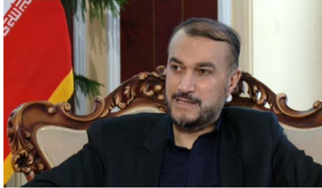
חסין אמיר עבדאללהיאן (אלעאלם, 17 במאי 2020)

המזוינים בסוריה וחיל האוויר הרוסי במערכה נגד הטרור. לפיכך, אין הצדקה לדילול הנוכחות האיראנית בסוריה כל עוד היא נדרשת לשמירת הביטחון במדינה.