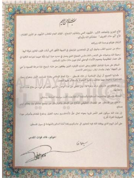
אגרת קאסם סלימאני למחמד דיף (אלמיאדין, 19 במאי 2020)

◀ לרגל יום ירושלים העולמי, חשף הערוץ הלבנוני אלמיאדין (19 במאי 2020) איגרת, ששלח מפקד כוח קדס במשמרות המהפכה, קאסם סלימאני, טרם חיסולו בינואר 2020, לראש הזרוע הצבאית של חמאס, מחמד דיף. במכתבו, כינה סלימאני את דיף "השהיד החי והאמיץ" והדגיש, כי איראן לא תנטוש את פלסטין לבדה ללא קשר להתגברות הלחצים והמצור. הוא כתב, כי התמיכה בפלסטין היא כבוד וגאווה עבור איראן וכי היא לעולם לא תוותר על חובה דתית זו. "ידידי פלסטין הם ידידי איראן ואויבי פלסטין הם אויבי האיראנים", כתב סלימאני.