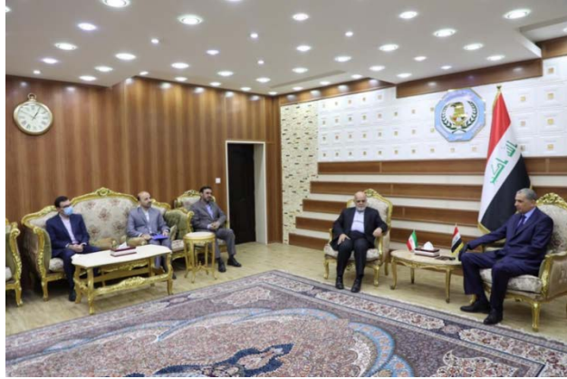
פגישת שגריר איראן והנספח הצבאי האיראני בבגדאד עם שר הפנים העיראקי (אירנ"א, 24 במאי 2020)

◀ שגריר איראן בבגדאד, אירג' מסג'די (Iraj Masjedi), והנספח הצבאי האיראני בבגדאד, מצטפא מראדיאן (Mostafa Moradian), נפגשו ב-24 במאי 2020 עם שר הפנים העיראקי, עת'מאן אלע'אנמי, ושוחחו עימו על המשך שיתוף הפעולה בין שתי המדינות במאבק בטרור, משבר הקורונה, סוגיות קונסולריות ופעילות מעברי הגבול בין המדינות. שר הפנים העיראקי הצהיר, כי ארצו מוכנה להמשיך בשיתוף הפעולה עם טהראן בתחומים שונים, ובכלל זה במאבק בטרור (אירנ"א, 24 במאי 2020). במקביל נפגש השגריר מסג'די עם נביל עבד אלצאחב, שר ההשכלה הגבוהה והמחקר המדעי של עיראק. מסג'די הביע במהלך הפגישה את נכונות איראן להגביר את שיתוף הפעולה המדעי והאקדמי בין שתי המדינות (אירנ"א, 24 במאי 2020).