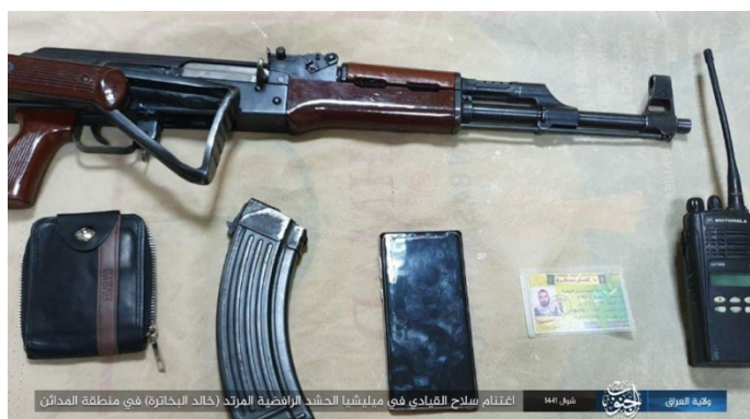
הציוד שנמצא ברשותו של המפקד בגיוס העממי, שנהרג ע"י פעילי דאעש (אצדאראת, 10 ביוני 2020).

9 ביוני 2020: בוצע ירי מקלעים לעבר מפקד בגיוס העממי, כעשרים ק"מ מדרום-מזרח לבגדאד. המפקד נהרג (אצדאראת, 10 ביוני 2020).