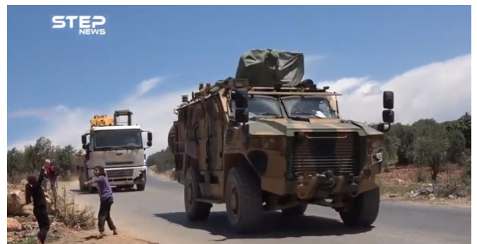
מימין: כלי רכב ממוגן של צבא תורכיה. משמאל: משאית של צבא תורכיה הנושאת מבני בטון (ח'טוה, 14 ביוני 2020).