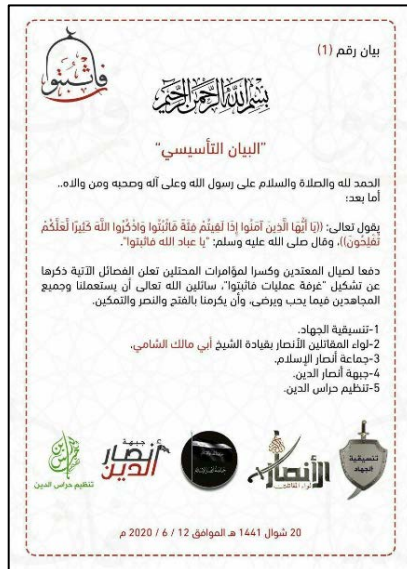
כרוז מספר 1, שהודיע על הקמת חדר המבצעים "עמדו עמידה איתנה" (טלגרם, 12 ביוני 2020).