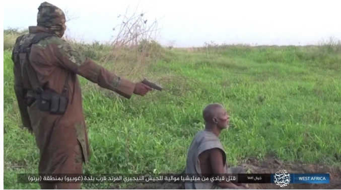
מפקד כוח המסייע לצבא ניגריה נורה למוות (אצדאראת, 16 ביוני 2020).