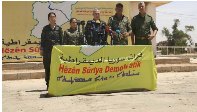
מסיבת עיתונאים, שבה הודיעו כוחות SDF על תוצאות מבצע "הרתעת הטרור" (24 Kurdistan, 10 ביוני 2020).