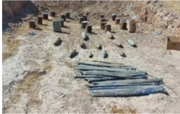
أسلحة تنظيم الدولة الإسلامية التي تم ضبطها في محافظة كركوك (السومرية، 9 آب/ أغسطس 2020).

◀ 9 آب/ أغسطس 2020: عثرت قوات الأمن العراقية على مستودع أسلحة تابع لتنظيم الدولة الإسلامية في محافظة كركوك، حيث كان المستودع يحتوي على عبوات ناسفة وأسلحة وذخيرة (السومرية، 9 آب/ أغسطس 2020).