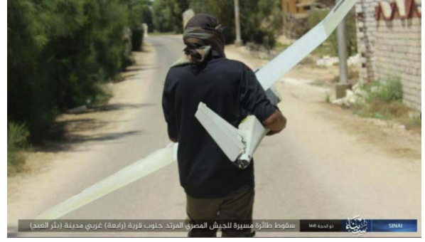
الطائرة المُسيرة التي اسقطها عناصر تنظيم الدولة الإسلامية (تلغرام، 9 آب/ أغسطس 2020).