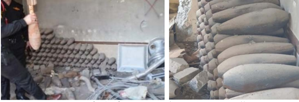
قذائف هاون تم العثور عليها في المعمل (السومرية، 9 آب/ أغسطس 2020).