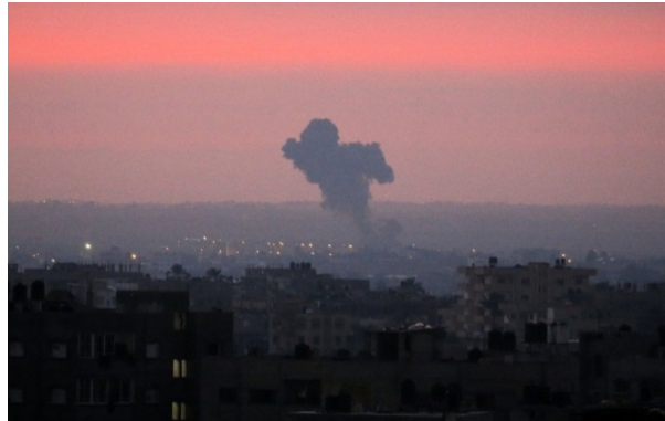
תקיפות צה"ל ברצועה (מימין: דף הפייסבוק שהאב, 21 באוגוסט 2020, משמאל: חשבון הטוויטר של רצ'ואן אלאח'רס, 21 באוגוסט 2020).