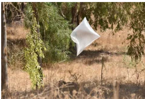
נטרול בלוני תבערה אשר אותרו בחווה חקלאית בשדות נגב (דוברות המשטרה, 18 באוגוסט 2020)