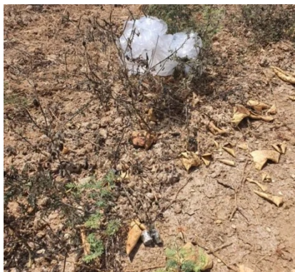
בלון תבערה שנוטרל ע"י חבלן משטרה באחד מיישובי שער הנגב (דוברות המשטרה, 22 באוגוסט 2020)