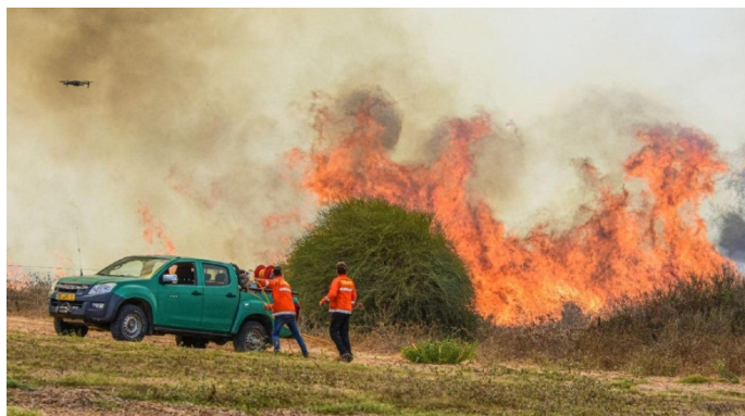
מימין: שריפה שפרצה ב-22 באוגוסט 2020. משמאל: כיבוי שריפה (דף הפייסבוק שהאב, 22 באוגוסט 2020)