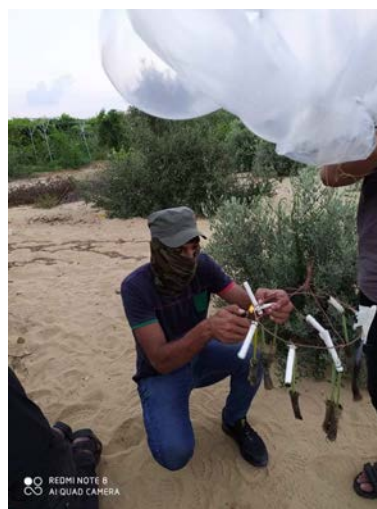
שיגור בלוני נפץ בידי פעילי התארגנות אחפאד אלנאצר (של ועדות ההתנגדות העממית)