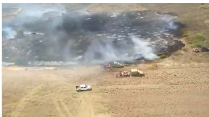
שריפה שפרצה סמוך לשדרות בעקבות שיגור בלוני תבערה. משמאל: נזק שנגרם לחממה כתוצאה משריפה (דף הפייסבוק שהאב, 22 באוגוסט 2020).