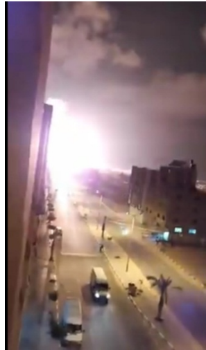
תמונה מסרטון המתעד את תקיפת "מוצב אלקדס" במערב ח'אן יונס (דף הפייסבוק שהאב, 21 באוגוסט 2020).