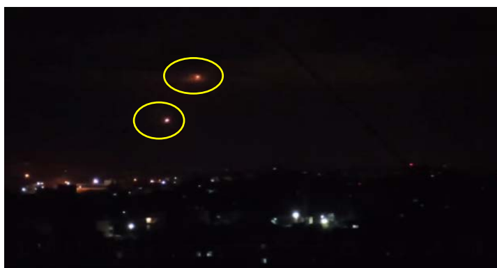
תמונה מסרטון פלסטיני המתעד שיגור שתי רקטות משטח הרצועה לעבר ישראל (דף הפייסבוק שהאב, 21 באוגוסט 2020)

◆ 22 באוגוסט 2020: שלוש רקטות שוגרו מהרצועה. הרקטות יורטו על ידי מערכת כיפת ברזל. שלוש רקטות נוספות ששוגרו (בשני אירועים שונים) נפלו בשטח הרצועה. בתגובה תקפו טנקים של צה"ל עמדות צבאיות של חמאס בדרום רצועת עזה (דובר צה"ל, 22 באוגוסט 2020).