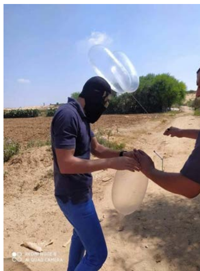
שיגור בלונים בידי פעילי אחפאד אלנאצר (של ועדות ההתנגדות העממית) בצפון הרצועה