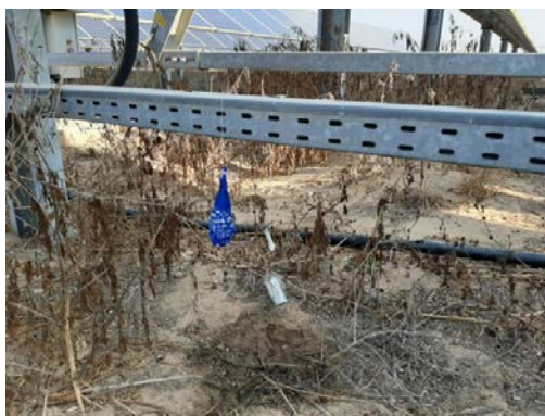
מימין: בלון תבערה שנחת בחצר בית בשדרות (דוברות אשכול, 18 באוגוסט 2020). משמאל: בלון נפץ שאותר בקיבוץ סעד (חשבון הטוויטר של מרחב לבנון איוש ועזה, 19 באוגוסט 2020)