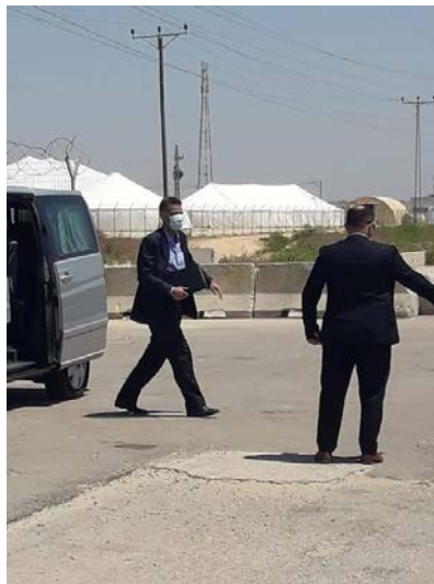
הגעת המשלחת המצרית לרצועה

משלחת המודיעין הכללי המצרית בראשות האלוף (לואי') אחמד עבד אלח'אלק, האחראי על התיק הפלסטיני הגיעה לרצועת עזה. המשלחת נועדה עם הנהגת חמאס ובכירים משאר הארגונים. הביקור הסתיים בכישלון . במהלך שהיית חברי המשלחת ברצועה ולאחריה נמשכה הפעילות האלימה של חמאס ושאר ארגוני הטרור. גם לאחר שעזבה המשלחת המצרית את רצועת עזה, הודיעו מספר ההתארגנויות, כי בדעתן להמשיך ואף להגביר את שיגור בלוני הנפץ והתבערה .