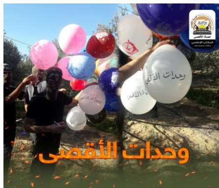
מימין: שיגור בלונים על ידי התארגנות מגני אלאקצא (המזוהה עם חמאס) (ערץ הטלגרם של מגני אלאקצא, 23 באוגוסט 2020). משמאל: שיגור בלוני נפץ בידי פעילי יחידות בני אלקוקא של תנועת ההתנגדות העממית ממזרח בית חאנון (פורום ABRRAR, 21 באוגוסט 2020)