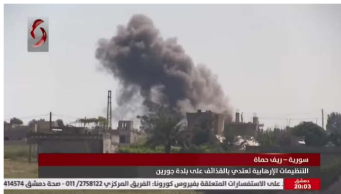
ירי ארטילרי של כוחות המורדים לעבר כוחות צבא סוריה (ערוץ אלאח'באריה אלסוריה, 6 במרץ 2021).

כמידי שבוע גם השבוע נמשכו חילופי הירי הארטילריים, בין כוחות המורדים, בראשות המטה לשחרור אלשאם, לבין כוחות צבא סוריה והכוחות המסייעים לו במרחב שמדרום ומדרום-מזרח למובלעת המורדים באדלב (אלאח'באריה אלסוריה, מרכז המעקב הסורי לזכויות אדם, מרץ 2021). כסיוע לצבא סוריה תקפו מטוסי קרב רוסיים יעדי מורדים מצפון לאדלב (מרכז המעקב הסורי לזכויות אדם, 5 במרץ 2021). לא דווח על נפגעים. ב-9 במרץ נהרגו שלושה חיילים ועשרה נפצעו מירי רקטות של כוחות המורדים (מרכז המעקב הסורי לזכויות אדם, 9 במרץ 2021).