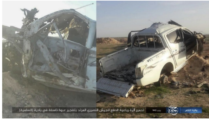
רכב השטח של צבא סוריה שהושמד באזור סלמיה (טלגרם, 6 במרץ 2021).