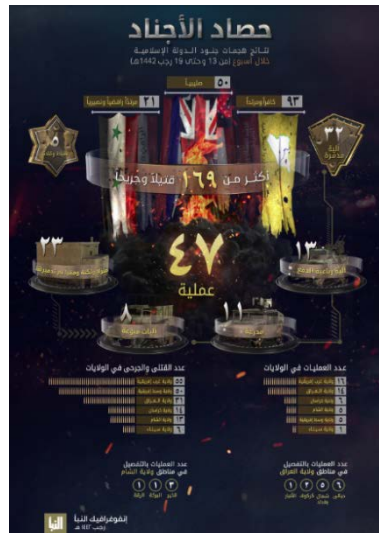
האינפוגרף כפי שהופיע בשבועון אלנבא' של דאעש.