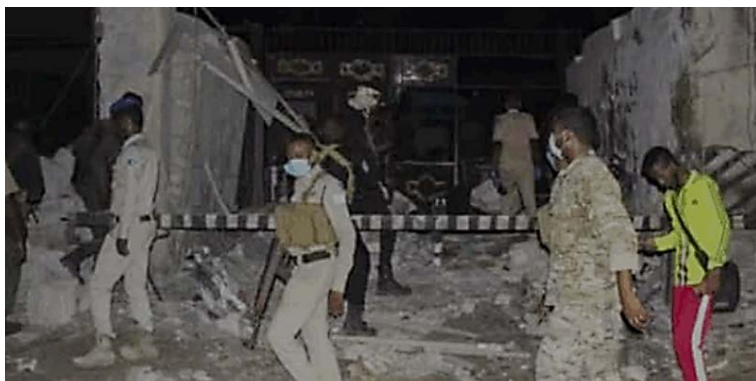
זירת פיצוץ מכונית התופת במוגדישו (סוכנות שהאדה, המזוהה עם תנועת אלשבאב, 6 במרץ 2021).

מקורות רשמיים בסומליה, דיווחו כי לפחות עשרים בני-אדם נהרגו וכשלושים נפצעו בפיצוץ מכונית תופת באזור הנמל (פרנסס, 24, 6 במרץ 2021).