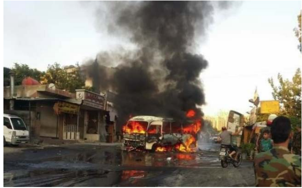
מימין: האוטובוס שנפגע עולה באש. משמאל: האוטובוס שנפגע.