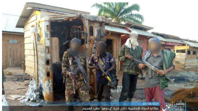
פעילי דאעש בכפר אידוהו (טלגרם, 4 באוגוסט 2021).