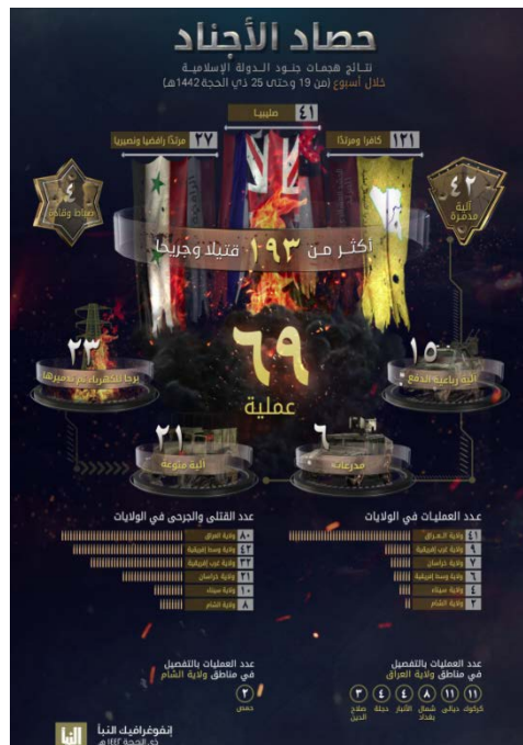
האינפוגרף המפרט את פעילות דאעש (שבועון אלנבא', טלגרם, 5 באוגוסט 2021).

על-פי האינפוגרף, בהתקפות נהרגו ונפצעו לפחות 193 בני אדם, לעומת 88 בני אדם בשבוע שקדם. מספר הרוגים והפצועים הגדול ביותר היה במחוז עיראק (80); שאר ההרוגים והפצועים היו במחוזות הבאים: מרכז אפריקה (42); מערב אפריקה (32); ח'ראסאן, קרי: אפגניסטאן (21); סיני (10); סוריה (8) (שבועון אלנבא', טלגרם, 5 באוגוסט 2021).