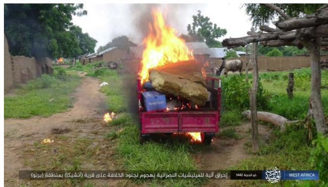
כלי רכב של מיליציות נוצריות באנשיקה שהועלה באש על-ידי פעילי דאעש (טלגרם, 9 באוגוסט 2021).

2 באוגוסט 2021: בוצעה תקיפה נגד מחנה של צבא ניגריה בגוביו (Gubio), כשמונים ק"מ צפונית-מערבית למידוגורי. במקום התנהלו חילופי-אש במהלכם נהרגו שמונה חיילים וכמה נוספים נפצעו. פעילי דאעש השתלטו על המחנה למשך זמן מה. למחנה נגרם נזק חומרי (טלגרם, 4 באוגוסט 2021).