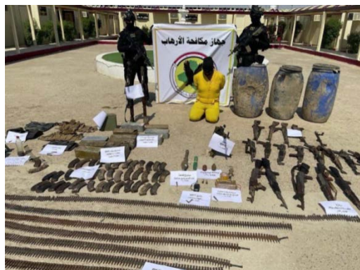
המפקד שנעצר ואמצעי הלחימה שנתפסו ברשותו (חשבון הטוויטר של דובר צבא עיראק, 5 באוגוסט 2021).

◆ 5 באוגוסט 2021: כוחות הביטחון העיראקיים עצרו מפקד בכיר במחוז צפון בגדאד של דאעש, שהיה אחראי, בין השאר, על העברת מחבלים מתאבדים. ברשות העצור נתפסו אמצעי לחימה רבים (חשבון הטוויטר של דובר צבא עיראק, 5 באוגוסט 2021).