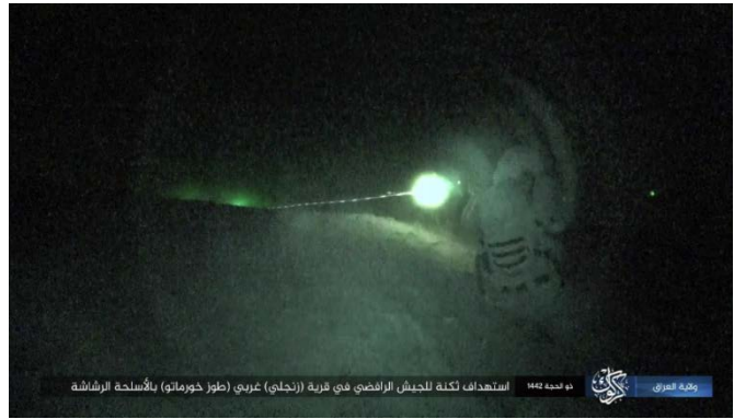
ירי לעבר המחנה צבא עיראק בזנג'לי (טלגרם, 9 באוגוסט 2021).

74 באוגוסט 2021: בוצע ירי לעבר חיילי צבא עיראק באזור אלמשהדה, כעשרים ק"מ צפונית לבגדאד. שני חיילים נהרגו. חייל נוסף נפצע (טלגרם, 8 באוגוסט 2021).