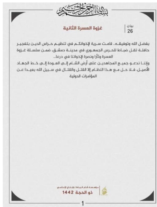
נוסח הודעת קבלת האחריות של ארגון חראס אלדין (טלגרם, 4 באוגוסט 2021).