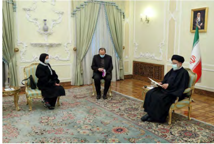
פגישת נשיא איראן עם שגרירת פלסטין בטהראן (אילנ"א, 8 בפברואר 2022).