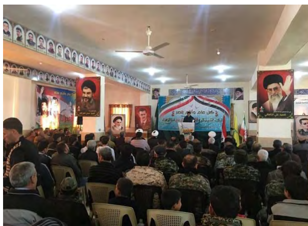
טקס יום השנה ה-43 למהפכה האסלאמית בדמשק (מהר, 13 בפברואר 2022).

◀ שגרירות איראן בסוריה קיימה ב-12 בפברואר 2022 טקס במלון שרתון בדמשק לרגל יום השנה ה-43 למהפכה האסלאמית. בטקס השתתפו שגריר איראן בדמשק, מהדי סבחאני (Mehdi Sobhani), נציגי הממשל הסורי ואנשי דת סורים, לבנונים ופלסטינים. סגן שר החוץ הסורי, בשאר ג'עפרי (Bashar Ja'fari), אמר בטקס, כי איראן היא שותפתה האסטרטגית של סוריה וכי ארצו מעוניינת להעמיק ולחזק את שיתוף הפעולה עימה בכל התחומים. הוא ציין, כי סוריה הייתה מבין המדינות הראשונות שתמכו במהפכה האסלאמית וכי היא רואה במהפכה תומכת של מדינות האזור ולא איום עליהן (איסנ"א, 13 בפברואר 2022).