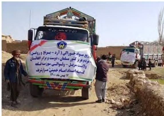
משלוח סיוע איראני לאפגניסטאן (תסנים, 6 בפברואר 2022).

◀ משלוח סיוע הומניטרי איראני נוסף נשלח בראשית פברואר לאפגניסטאן. הסיוע חולק לנזקקים במחוז סרפל (Sarpol) שבצפון המדינה. המשלוח כלל 30 טון קמח, אורז ושמן. כל משפחה בסוזמה קלעה (Sozma Qala) שבמחוז סרפל קיבלה שק קמח במשקל 50 ק"ג, שק אורז במשקל 10 ק"ג ובקבוק שמן במשקל 5 ליטרים. סוכנות הידיעות תסנים דיווחה (6 בפברואר 2022), כי בעת חלוקת הסיוע, נכח מושל המחוז במקום. על-פי דיווח תסנים, העבירה איראן עד כה 13 משלוחים של סיוע הומניטרי למחוזות קאבול, הראת, קנדוז, קנדהאר ונגרהאר שבאפגניסטאן. בתוך כך, דיווח הניו-יורק טיימס (2 בפברואר), כי מאז חודש אוקטובר 2021 ועד סוף ינואר 2022, חצו למעלה ממיליון אפגאנים את הגבול לאיראן בדרום-מערב אפגניסטאן. להערכת ארגוני סיוע בינלאומיים, בין 4,000 ל-5,000 בני אדם חוצים מדי יום את הגבול מאפגניסטאן לאיראן מאז השתלטות הטאלבאן על המדינה.