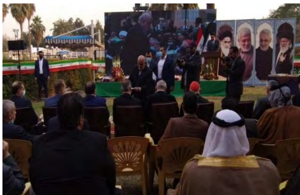
טקס יום השנה למהפכה האסלאמית בשגרירות איראן בבגדאד (אירנ"א, 11 בפברואר).

רגל הנכנסים לעיראק בדרך היבשה. טקס יום השנה למהפכה האסלאמית בשגרירות איראן בבגדאד נערך בהשתתפות פוליטיקאים עיראקים בכירים, ובראשם ראש סיעת "החוכמה הלאומית", סיד עמאר חכים; ראש קואליציית "פתח" בפרלמנט, האדי אלעאמרי; וראש ממשלת עיראק לשעבר, עאדל עבד אלמהדי, דיפלומטים זרים, אנשי דת שיעים וסונים, ראשי שבטים ונציגי חברות איראניות הפועלות בעיראק (אירנ"א, 11 בפברואר 2022).