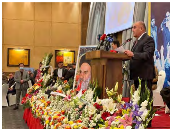
טקס יום השנה למהפכה האסלאמית בארבייל, צפון עיראק (אירנ"א, 13 בפברואר 2022).

לאיראן השפעה אזורית רבה וכי יחסיה עם החבל הכורדי בתחומים הפוליטי, הכלכלי, התרבותי והחברתי נמצאים ברמה גבוהה ויש לנצל את ההזדמנות על מנת לבססם ולהרחיבם אף יותר (אירנ"א, 13 בפברואר 2022).