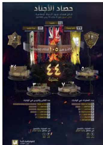
סיכום פיגועי דאעש (שבועון אלנבא', טלגרם, 17 בפברואר 2022).

◀ מנתוני אינפוגרף, שפרסם דאעש, המסכם את פעילות הארגון ברחבי העולם בתקופה שבין 10-16 בפברואר 2022, עולה כי במהלך תקופה זו ביצעו פעילי הארגון 44 פעולות טרור במחוזות השונים באסיה ובאפריקה, לעומת 35 בשבוע שעבר. מספר הפעולות הגדול ביותר בוצע במחוז מערב אפריקה (24 התקפות). בשאר המחוזות: עיראק (9); סוריה (4); מרכז אפריקה (3); ח'ראסאן (קרי: אפגניסטאן) (2); חצי האי סיני (1) מזרח אסיה (1). בפיגועים נהרגו ונפצעו 105 בני אדם, לעומת 134 בני אדם בשבוע שקדם. מספר ההרוגים והפצועים הגדול ביותר היה במחוז מערב אפריקה (61). שאר ההרוגים והפצועים היו במחוזות הבאים: עיראק (14); מרכז אפריקה (14); סוריה (11); סיני (3); ח'ראסאן, (שבועון אלנבא', טלגרם, 17 בפברואר 2022).