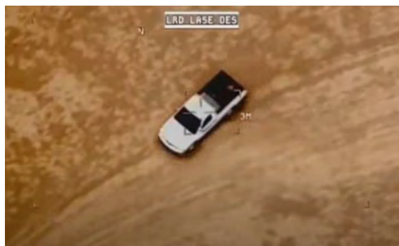
תיעוד כלי הרכב והפגיעה בו (מפקדת הכוחות המשותפים העיראקיים, 18 בפברואר 2022).