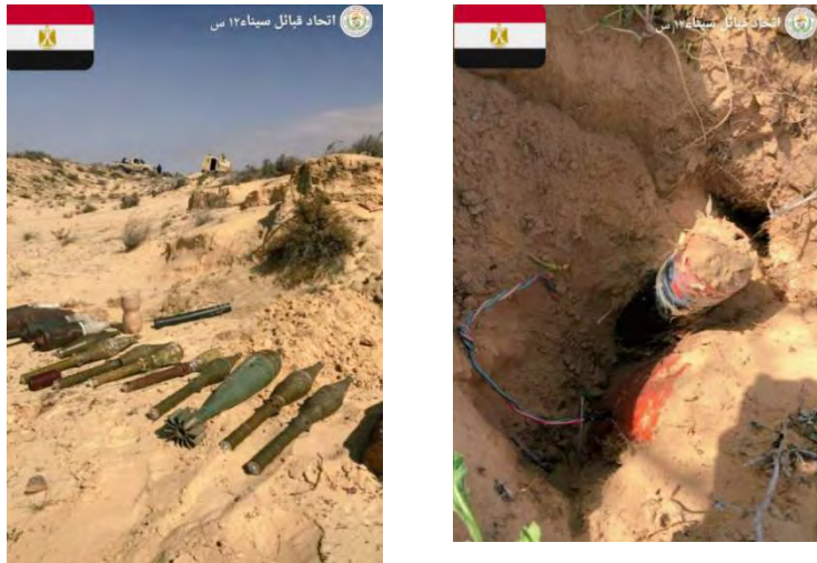
מצעני להחימה שאותרו (חשבון הטוויטר @AlsynawyMrad, 14 בפברואר 2022)

◀ 14 בפברואר 2022: צבא מצרים והכוחות השבטיים המסייעים לו איתרו מצבור מטעני-חבלה, פגזים ורקטות אר.פי.ג'י (חשבון הטוויטר @AlsynawyMrad, 14 בפברואר 2022).