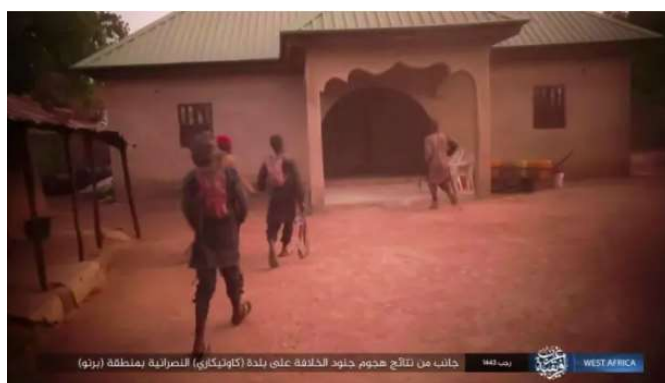
פעילי דאעש בקאוטיקארי (טלגרם, 27 בפברואר 2022).

◀ 25 בפברואר 2022: בוצע ירי לעבר לוחמי מיליציה בעיירה הנוצרית קאוטיקארי במדינת בורנו, בצפון-מזרח ניגריה. ארבעה לוחמים נהרגו והכנסייה בעיירה הועלתה באש.