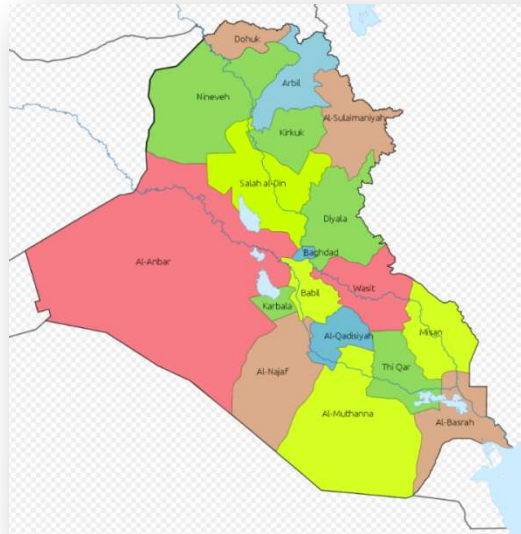
מחוזות עיראק (ויקיפדיה)