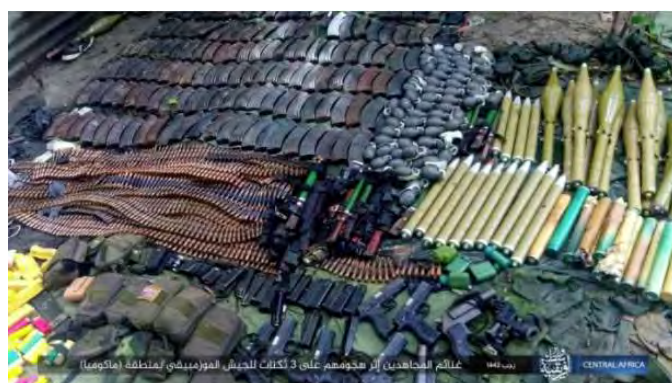
אמצעי הלחימה שלקחו פעילי דאעש (טלגרם, 27 בפברואר 2022).