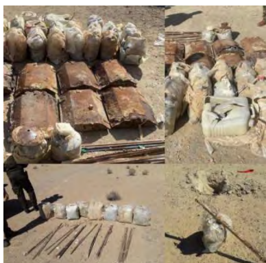
מטעני החבלה ופסי הדריכה שאותרו (חשבון הטוויטר של ח'לית אלאעלאם אלמני, 27 בפברואר 2022).

◀ ב-1 במרץ 2022 עצרו כוחות הביטחון של עיראק באזור אלשרקאט, בצפון המחוז, את אחראי הכספים של אזור החידקל (דג'לה) של דאעש ואת עוזרו (חשבון הפייסבוק של ח'לית אלאעלאם אלמני, 1 במרץ 2022). ◀ בתקיפה שביצע חיל האוויר העיראקי נהרגו שלושה פעילי דאעש (דף הפייסבוק ח'לית אלאעלאם אלמני, 1 במרץ 2022). לא צוין מיקום מדויק של התקיפה. מספר ימים קודם לכן איתרו כוחות הביטחון העיראקיים מטעני חבלה ופסי דריכה, ככל הנראה של פעילי דאעש, סמוך להיות (חשבון הטוויטר של ח'לית אלאעלאם אלמני, 27 בפברואר 2022).