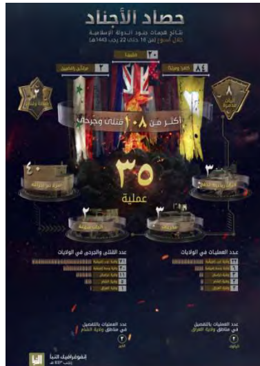
סיכום הפיגועים (שבועון אלנבא', טלגרם, 24 בפברואר 2022).

◀ מנתוני אינפוגרף, שפרסם דאעש, המסכם את פעילות הארגון ברחבי העולם בתקופה שבין 17-23 בפברואר 2022 עולה, כי בתקופה זו ביצעו פעילי הארגון 35 התקפות במחוזות השונים באסיה ובאפריקה, לעומת 44 התקפות בשבוע הקודם. מספר ההתקפות הגדול ביותר בוצע על-ידי פעילי הארגון במחוז מערב אפריקה (22 התקפות). בשאר המחוזות: מרכז אפריקה (6); ח'ראסאן (קרי: אפגניסטאן) (3); עיראק (2); סוריה (2). בפיגועים נהרגו ונפצעו 108 בני אדם, לעומת 105 בני אדם בשבוע שקדם לו. מספר ההרוגים והפצועים הגדול ביותר היה במחוז מערב אפריקה (71). שאר ההרוגים והפצועים היו במחוזות הבאים: מרכז אפריקה (20); ח'ראסאן, (11); סוריה (5); עיראק (1) (שבועון אלנבא', טלגרם, 24 בפברואר 2022).