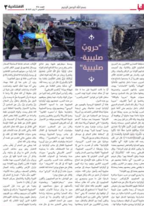
מאמר העוסק במלחמה באוקראינה (שבועון אלנבא', טלגרם, 3 במרץ 2022).

◆ יהיו התוצאות וההשלכות של המלחמה אשר יהיו, הן תשנינה את חוקי השלום והמלחמה באירופה.