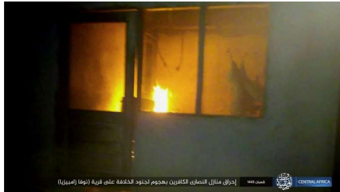
אחד מבתי העיירה עולה באש (טלגרם, 8 במרץ 2022).