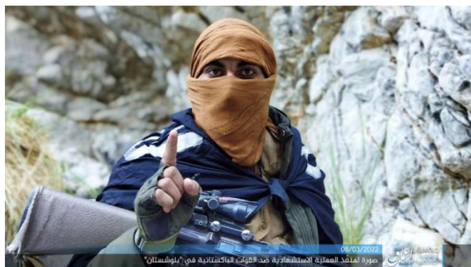
המחבל המתאבד לפני צאתו לביצוע הפיגוע (טלגרם, 8 במרץ 2022).