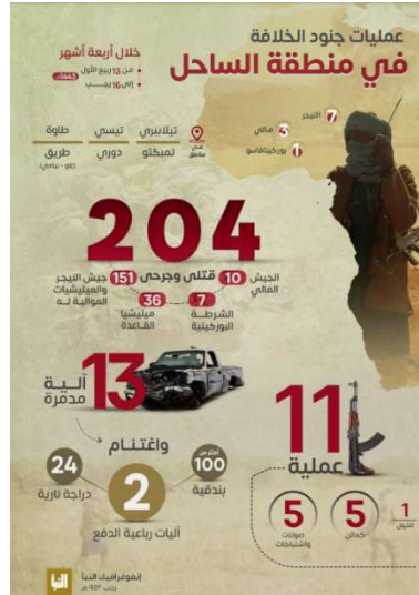
פעילות הארגון באזור הסאהל.