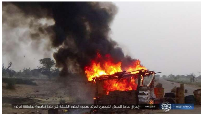
מחסום צבא ניגריה עולה באש (טלגרם, 8 במרץ 2022).

74 במרץ 2022: בוצע ירי לעבר מחסום של צבא ניגריה בדמבואה (Damboa), כשמונים ק"מ דרום-מערב למידוגורי, בצפון-מזרח ניגריה. חיילי המחסום נמלטו ופעילי דאעש העלו אותו באש.