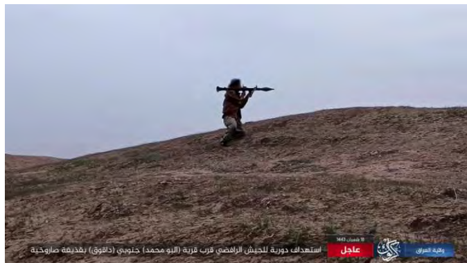
פעיל דאעש משגר רקטה לעבר כוח הסיוע של צבא עיראק (טלגרם, 21 במרץ 2022).

◀ 21 במרץ 2022: בוצע ירי לעבר עמדה של צבא עיראק ליד אלבו מחמד באזור דאקוק, שבדרום כרכוכ. חייל נהרג וחייל נוסף נפצע. לעבר כוח סיוע שהגיע למקום בוצע ירי ואף שוגרה לעברו רקטה.