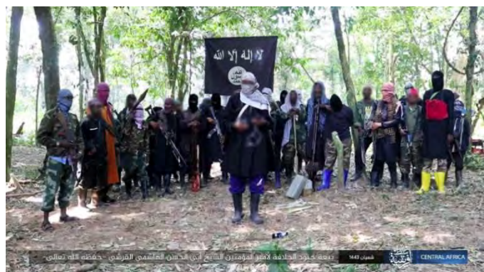
שבועת האמונים של פעילי מחוז מרכז אפריקה (טלגרם, 17 במרץ 2022).