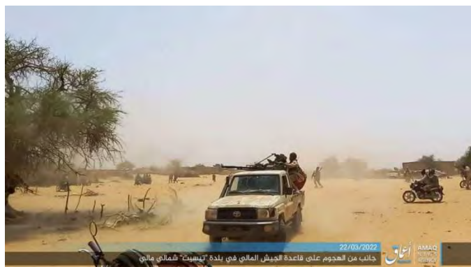
התקיפה נגד בסיס צבא מאלי (טלגרם, 22 במרץ 2022).