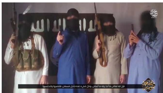
פעילי דאעש ממחוז ח'ראסאן נשבעים אמונים למנהיג הארגון (טלגרם, 21 במרץ 2022).