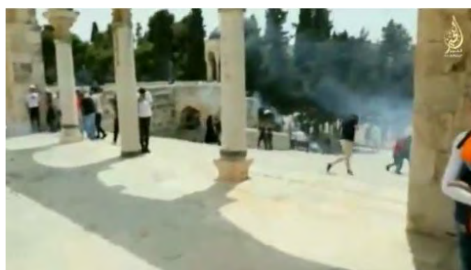
מימין: מהומות בהר הבית. משמאל: הדובר בסרטון מעודד את פיגועי ההשאה בישראל (טלגרם, 29 במרץ 2022).