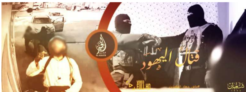
תמונת הפתיח של הסרטון "הלחימה ביהודים" (טלגרם, 29 במרץ 2022).

פיוטים המעודדים פיגועים, אחד מהם בגרמנית, שיכול אולי להעיד כי הסרטון הופק על-ידי תומכי הארגון בגרמניה (טלגרם, 29 במרץ 2022).