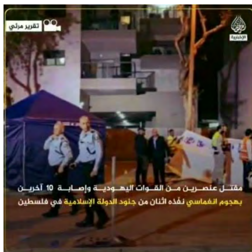
מתוך הסרטון תחת הכותרת "דיווח מצולם - פלסטין" (טלגרם, 28 במרץ 2022).