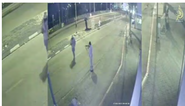
קטע ממצלמות האבטחה שתיעד את הפיגוע בחדרה ושולב בסרטון (טלגרם, 29 במרץ 2022).