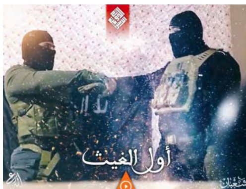
הסרטון תחת הכותרת "הגשם הראשון" (טלגרם, 28 במרץ 2022).

◀ אלדרע אלסני, מוסד המזוהה עם דאעש, תחת הכותרת "הגשם הראשון" (אול אלע'ית', במשתמע: בתקווה ובקריאה לכך שיהיו גשמים נוספים בהמשך). בסרטון נראים קטעים מסרטוני מצלמות האבטחה שהופצו בתקשורת מהפיגועים בבאר שבע וחדרה כשברקע נשמעים דברים של דבריו של אבו מחמד אלעדנאני, שהיה דובר הארגון המשבח את האנשים הבודדים המבצעים פיגועים (טלגרם, 28 במרץ 2022).